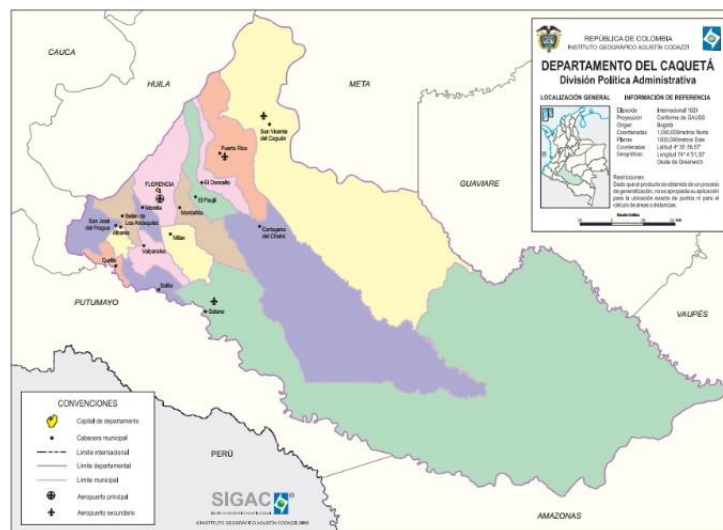
Figura 1 – Ubicación del Departamento de Caquetá