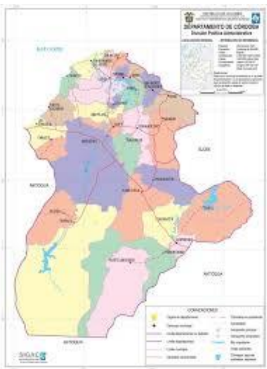
Figura 2 – Ubicación del Departamento de Córdoba