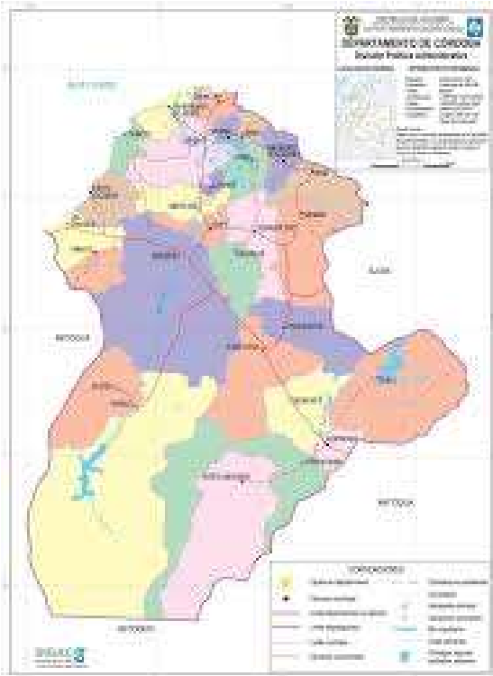
Figura 2 – Ubicación del Departamento de Córdoba