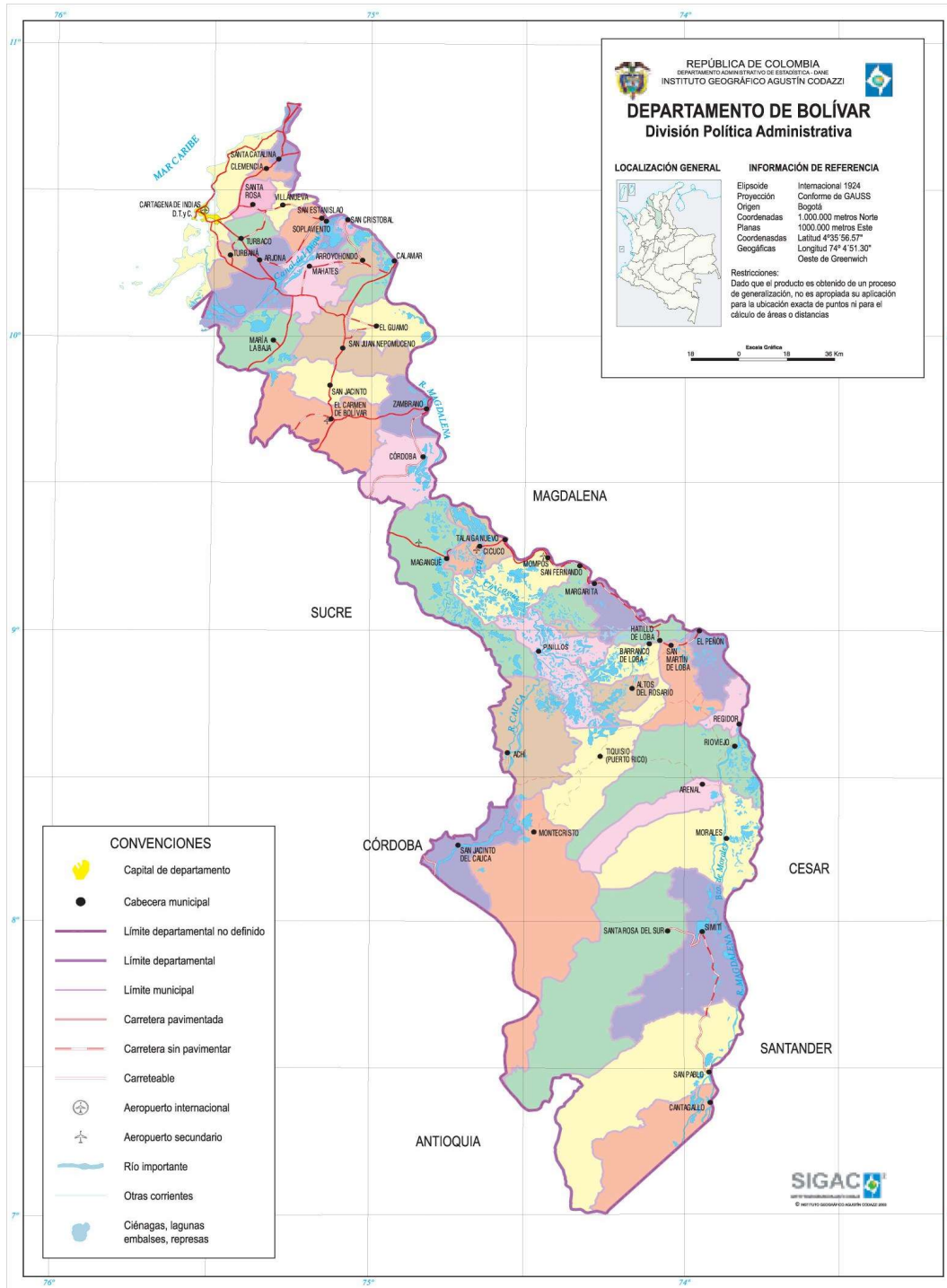
Figura 1 – Ubicación del Departamento de Bolívar