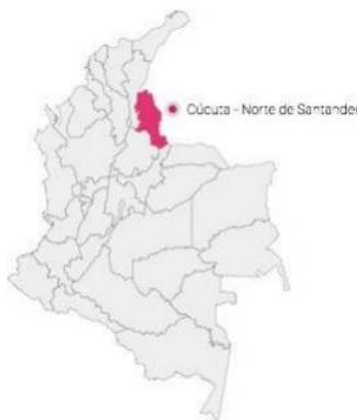
Las obras a ejecutar para el Grupo 2 se realizará en las sedes educativas descritas en el numeral 2.2. de los presentes Estudios Previos

CLÁUSULA TERCERA. – UBICACIÓN DEL PROYECTO: El lugar de ejecución del presente CONTRATO se encuentra discriminado, así;