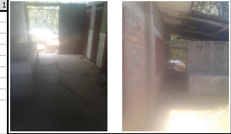
Bateria Sanitaria Vista 1