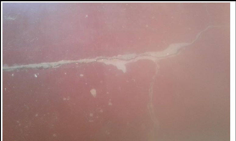
Comedor Vista 1