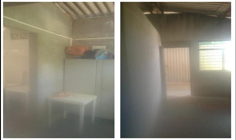
Cocina-Biblioteca Vista 1