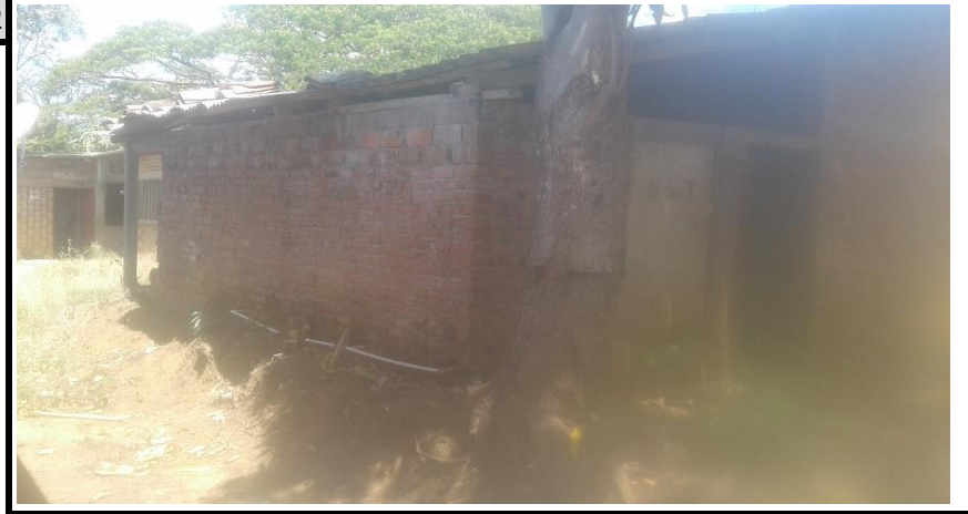
Bateria Sanitaria Vista 2