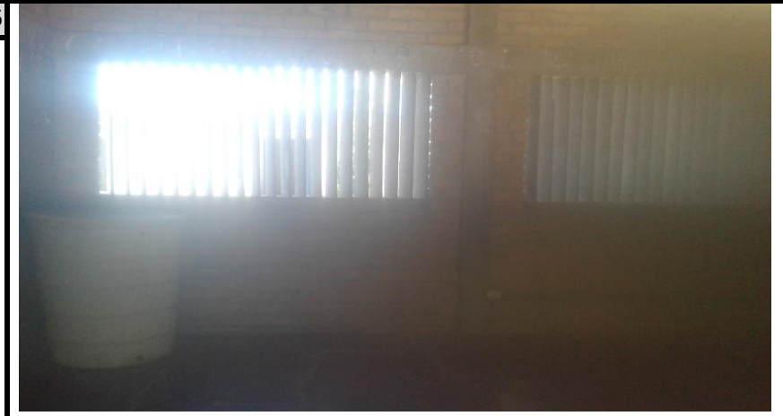
Comedor Vista 2