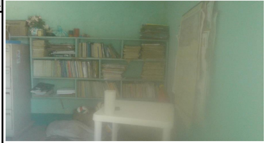
Cocina-Biblioteca Vista 2