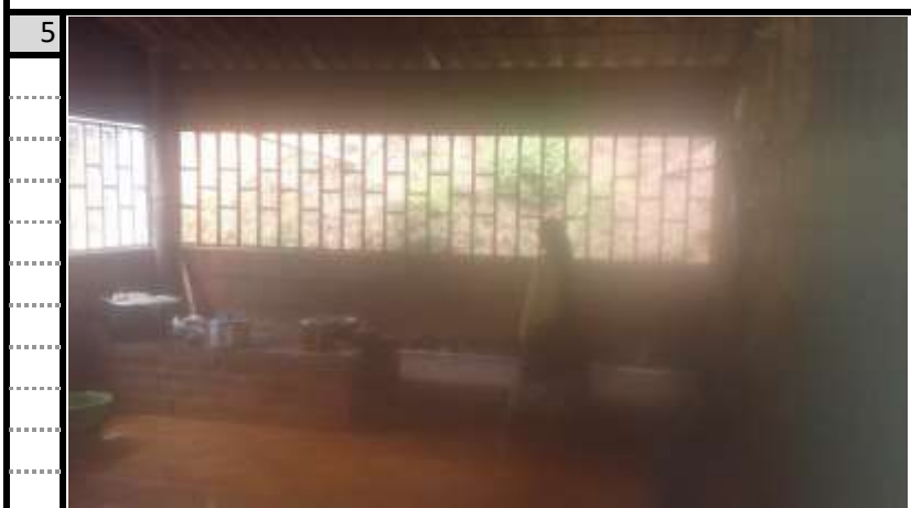
Cocina Vista 2