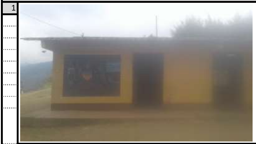
Bateria Sanitaria Vista 1