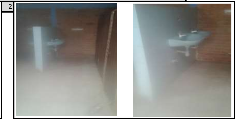
Bateria Sanitaria Vista 2