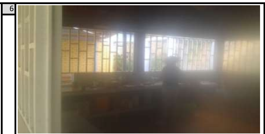
Cocina Vista 3