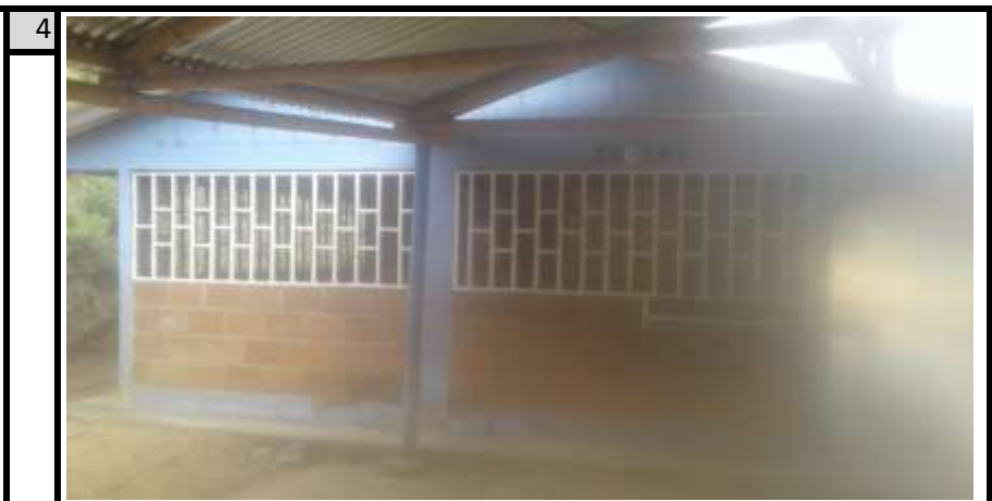
Cocina Vista 1