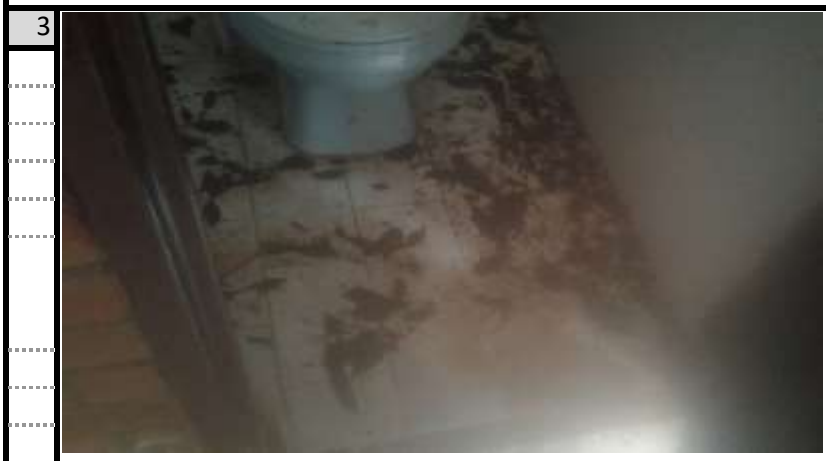
Bateria Sanitaria Vista 3