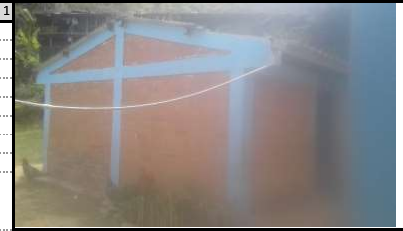
Bateria Sanitaria 1 Vista 1