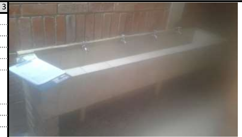
Bateria Sanitaria 1 Vista 3