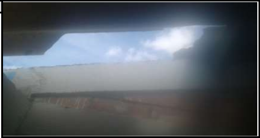
Bateria Sanitaria 1 Vista 2