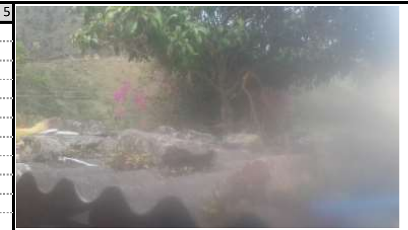
Bateria Sanitaria 2 Vista 2