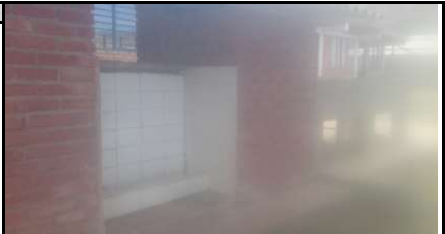
Bateria Sanitaria 2 Vista 3