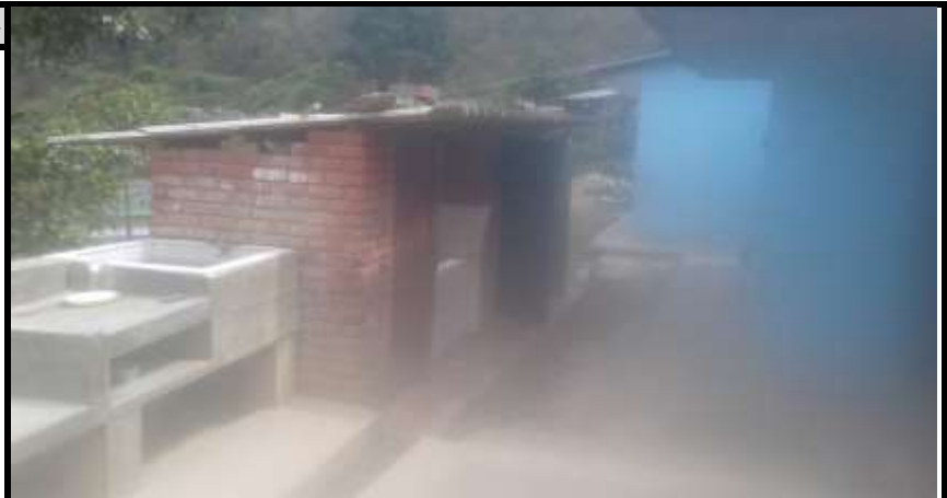
Bateria Sanitaria 2 Vista 1