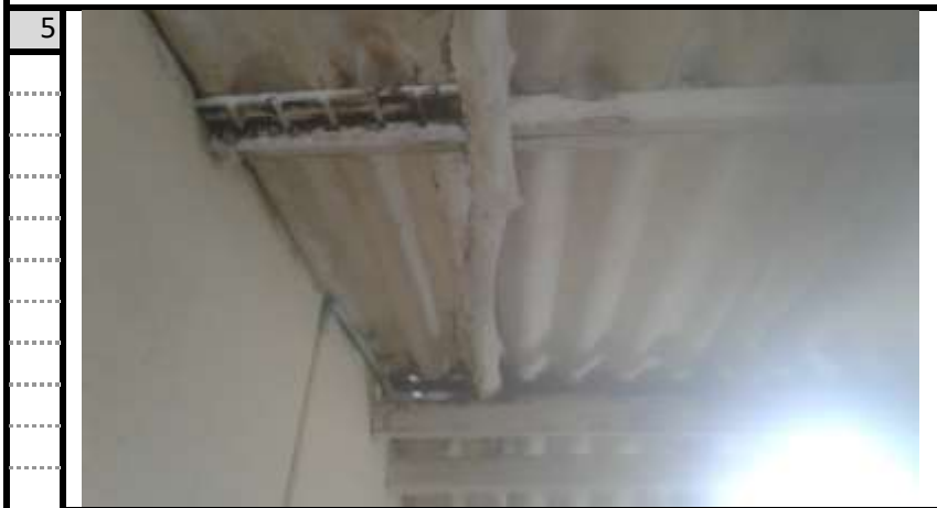
Oficina-S4 (Contiguo a Cocina-Comedor) Vista 1