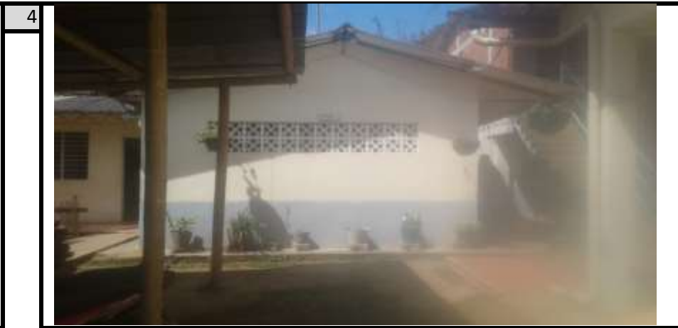
Espacio Ampliacion Comedor