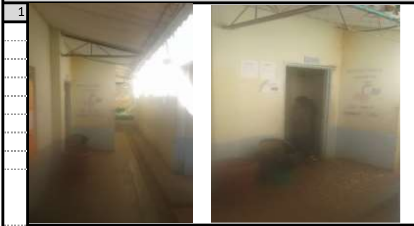
Cocina-Comedor Vista 1