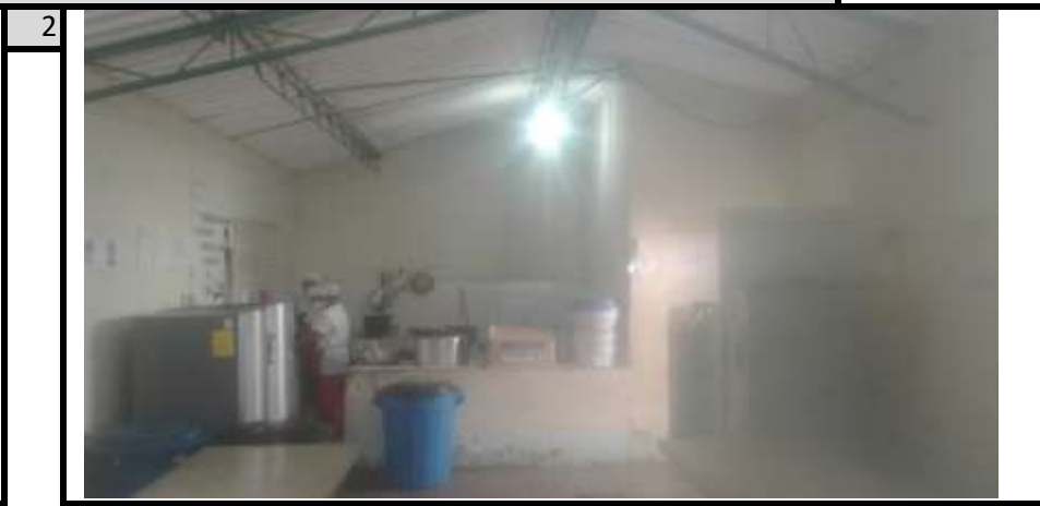
Cocina-Comedor Vista 2