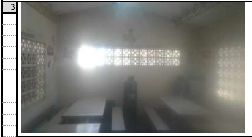
Cocina-Comedor Vista 3