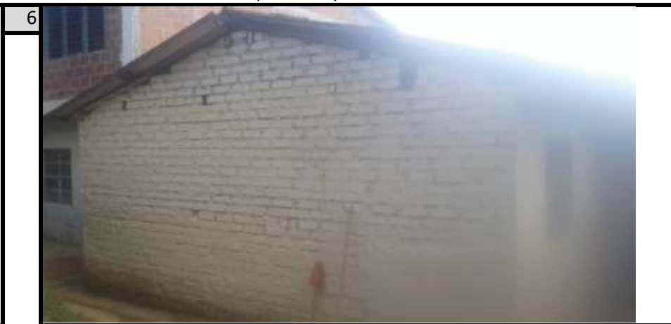
Oficina-S4 (Contiguo a Cocina-Comedor) Vista 2