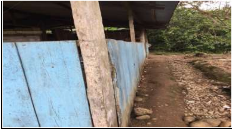
DETALLE DE MUROS EN MADERA