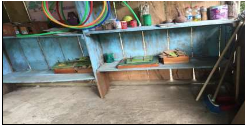
SALON DE CLASE