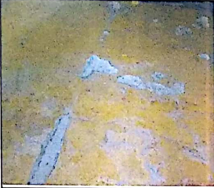
ESTADO DEL ENCHAPE DE PISO, AREA DE COCINA