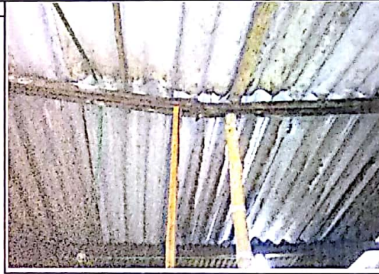
ESTRUCTURA DE CUBIERTA PERTENECIENTE A LA COCINA