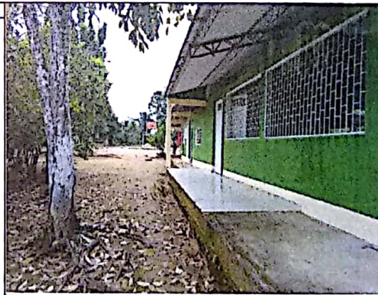
SE REQUIERE INSTALACION DE CANALES DE AGUAS LLUVIAS