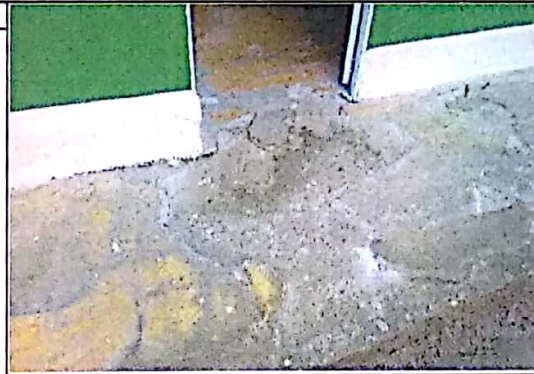
ESTADO DEL PISO DE ANDENES