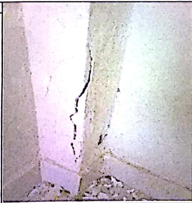
ESTADO DE UNA COLUMNA, AREA DEL COMEDOR