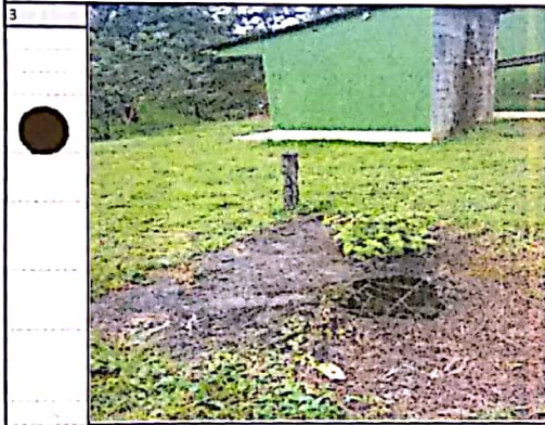
TAPA DE POZO SÉPTICO, PLACA EN MAL ESTADO