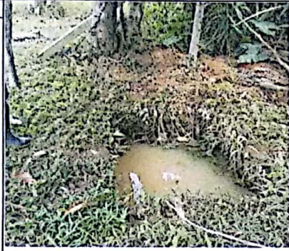
ABASTECIMIENTO DE AGUA