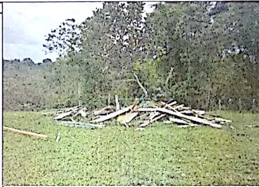
ESTADO DEL AULA, ACTUALMENTE SE BRINDAN CLASES EN UNA CASETA COMUNAL PROVISIONAL