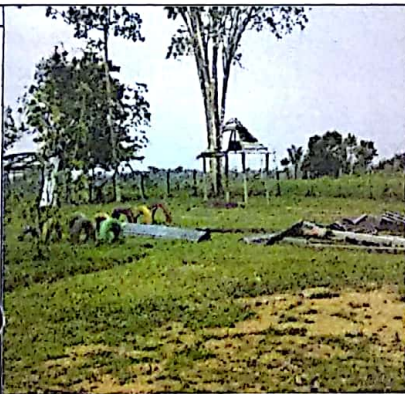
ZONA DE RECREACIÓN EN MAL USO, ACTUALMENTE SE ALOJAN HOJAS DE ZINC