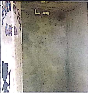
UNIDAD SANITARIA CARECE DE ENCHAFE