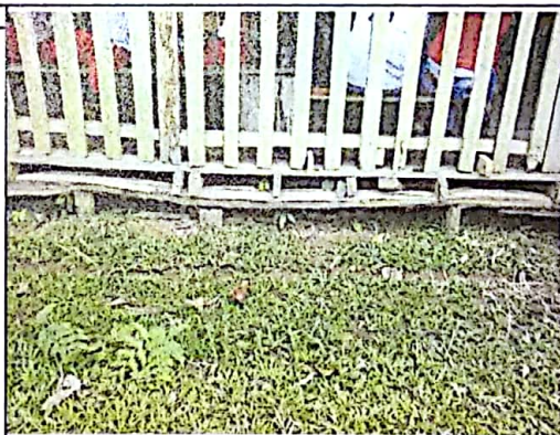
ESTADO DEL AULA PROVISIONAL