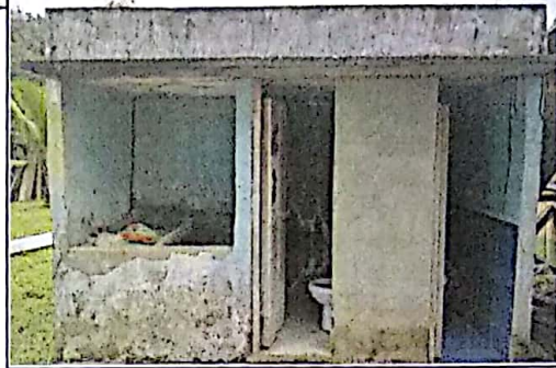
DETERIORO UNIDAD SANITARIA