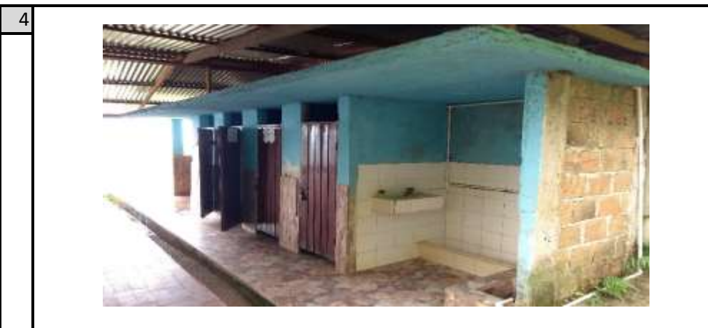
FACHADA PRINCIPAL BATERIA SANITARIA