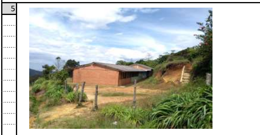
CUBIERTA AULA Y BIBLIOTECA