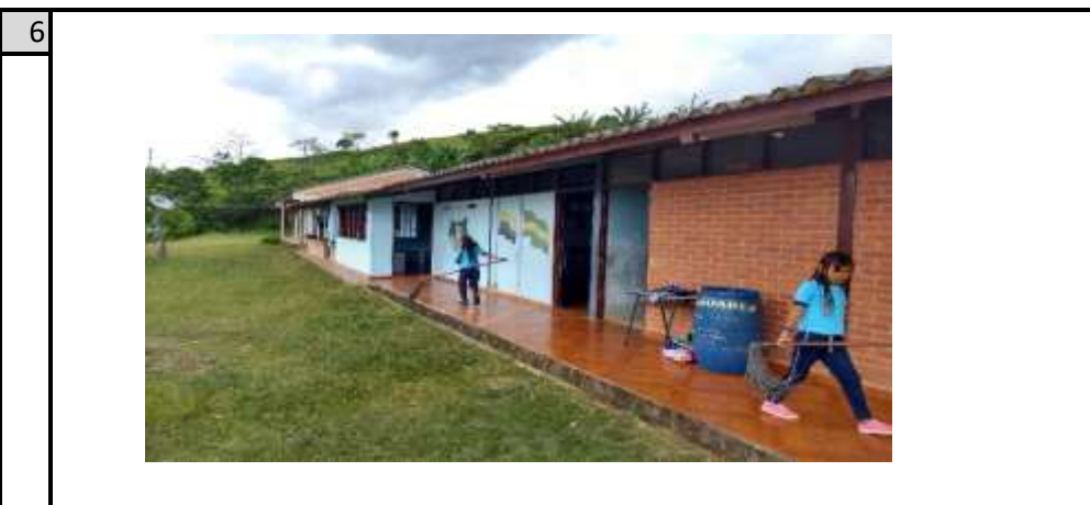
AULAS Y CORREDOR HACIA EL COMEDOR