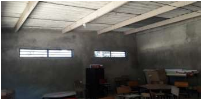
INTERIOR AULA 1