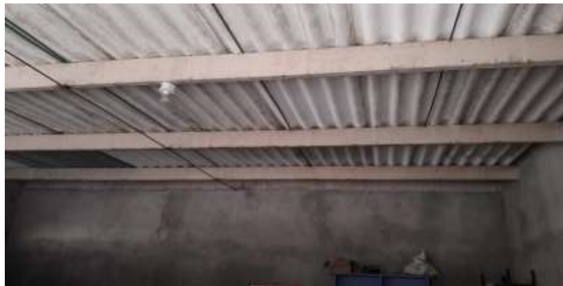
INTERIOR AULA 1