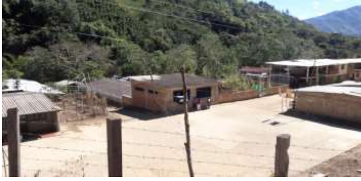
FACHADA AULA 1