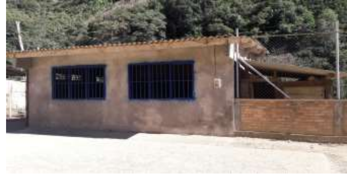
FACHADA AULA 1