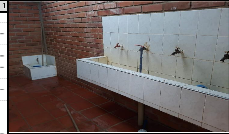
baños niñas poceta no funciona