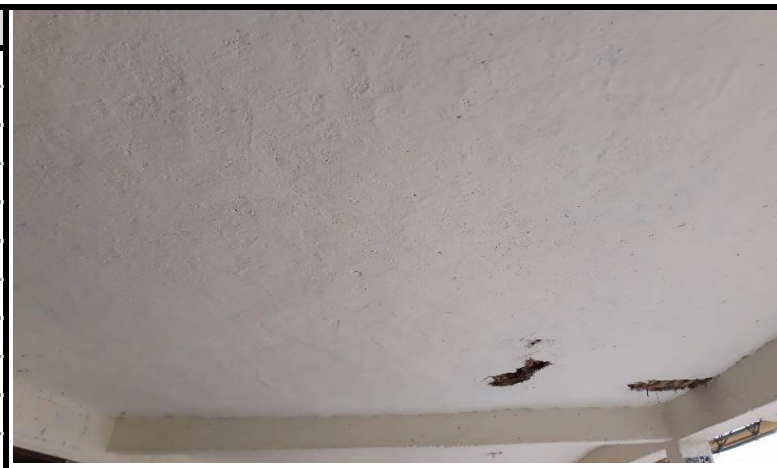
Aulas S1-S2 -s3 cielo falso peligro desprendimiento