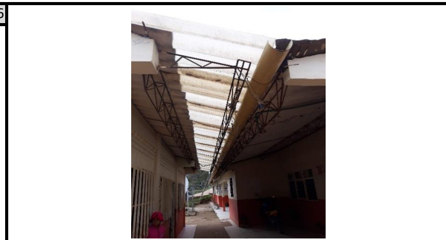
Aulas S1-S2 -s3 Vista de cubierta a cambiar