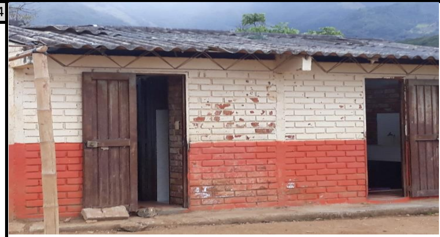
fachada de la bateria sanitaria