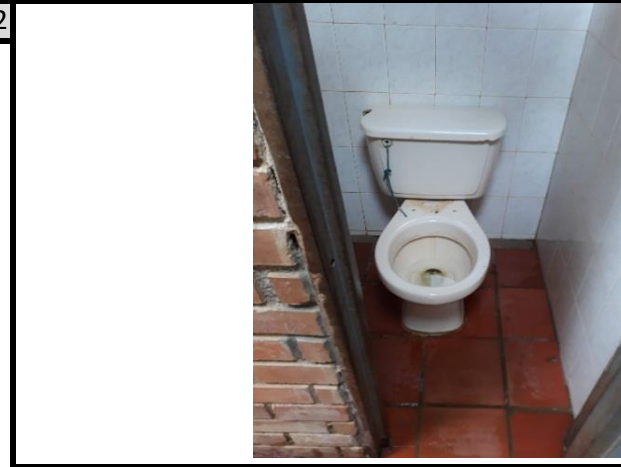
aparatos sanitarios dañados