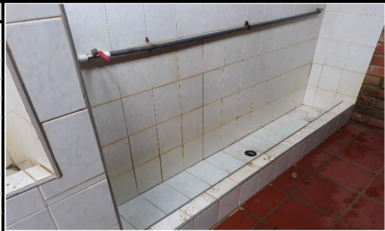
orinal corrido en mal estado