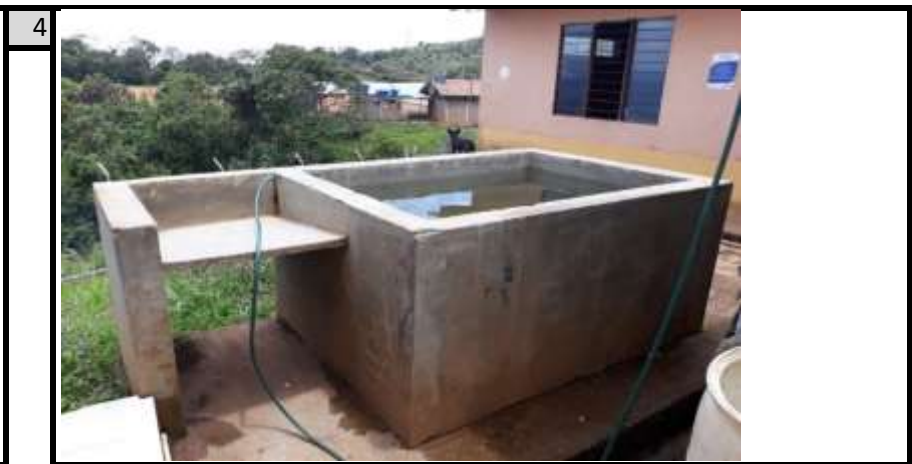
tanque de agua institucion