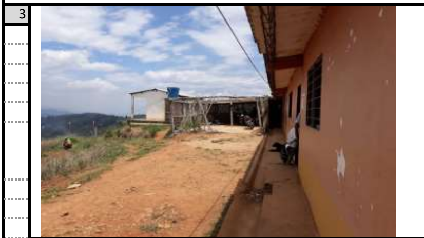
espacio para ampliacion comedor