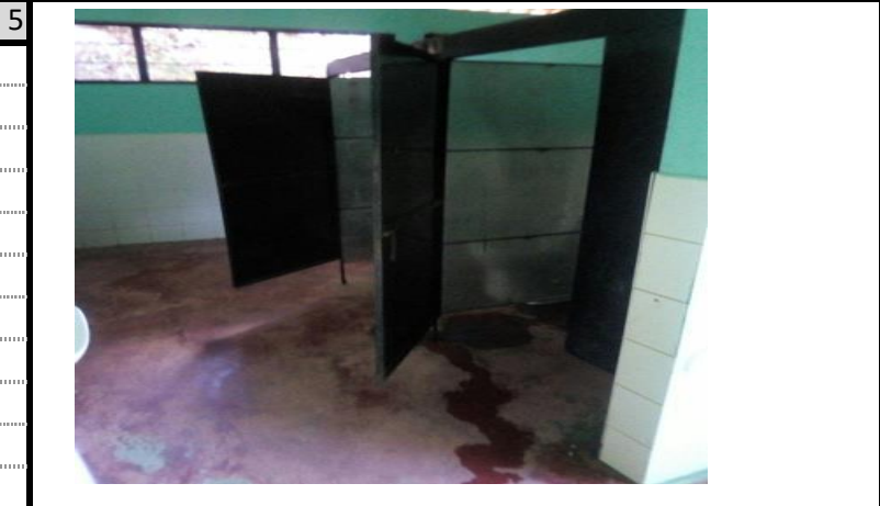
DIVISIONES BAÑOS EN METAL