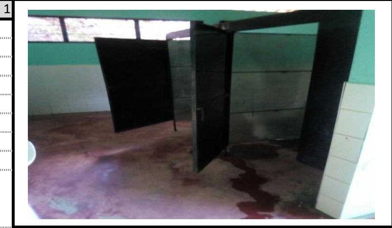
PISOS EN CEMENTO ESMALTADO