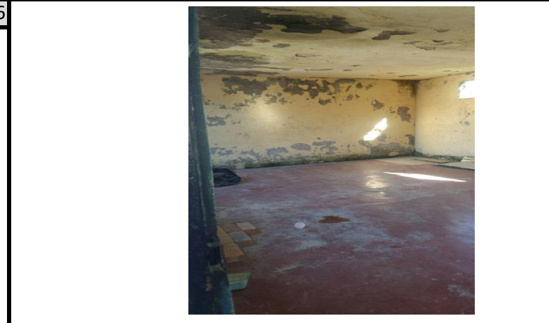
AULA NUMERO 5