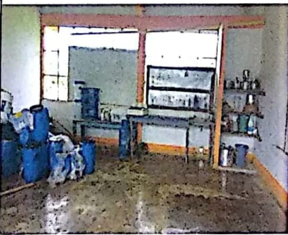
AULA DE CLASES ASIGNADA COMO RESTAURANTE PROVISIONAL