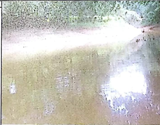
AGUA NO APTA PARA EL CONSUMO