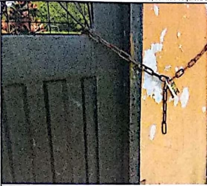
PUERTAS SIN CHAPAS, PROBLEMAS DE INSEGURIDAD