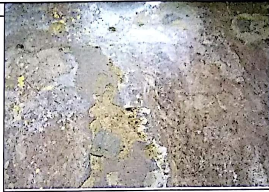
ENCHAPE DE PISO PLANTA FISICA