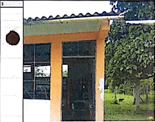
REPRESENTACION GENERAL, CANALES DE AGUAS LLUVIAS AULAS