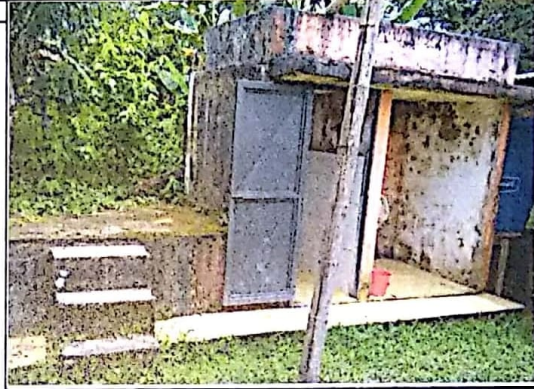
DETERIORO UNIDAD SANITARIA