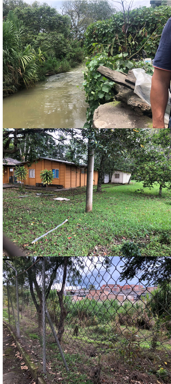
Ilustración 3. Recorrido fotográfico.

La INTERVENTORÍA deberá remitir a la Supervisión los productos establecidos para la ejecución del contrato, en cuatro (4) documentos originales en medio físico, junto con cuatro (4) copias en medio magnético, y/o de manera virtual y digital a través de los mecanismos tecnológicos que se acuerden con la Supervisión del contrato.