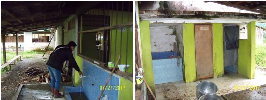
Área de la batería existente, ubicada en el comedor, ya la cual se deberá realizar su construcción, conforme al resultado del diagnóstico.