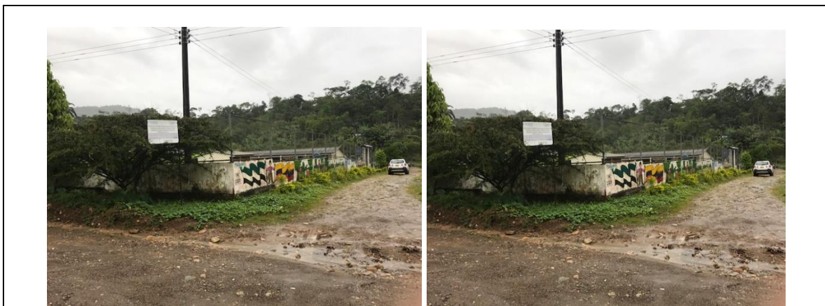
Accesibilidad a la Institución Educativa: De la vía que comunica Mocoa con Pitalito (Huila), vía nacional en buen estado,