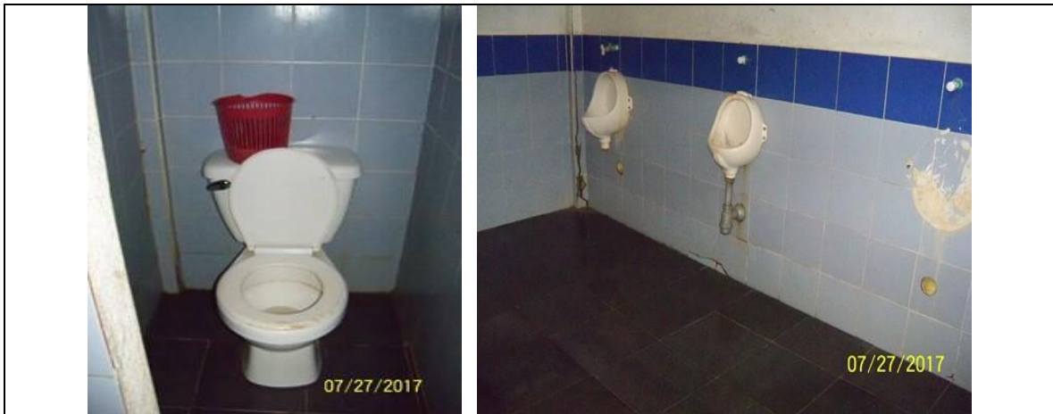
Estado actual de la batería sanitaria, en la cual se deberá realizar intervención indicada en los alcances.