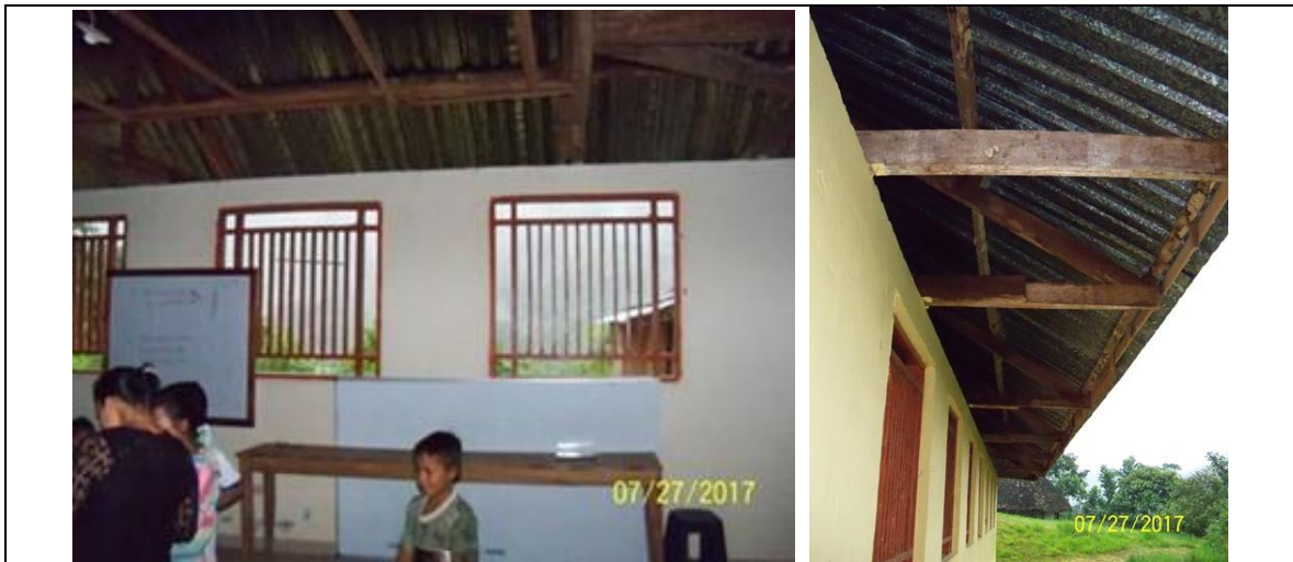
Área de la única aula escolar, a la cual se debe realizar la cambio de la cubierta y demás actividades mínimas indicadas en el alcance del proyecto