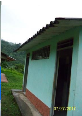
Módulo de la batería sanitaria a intervenir.