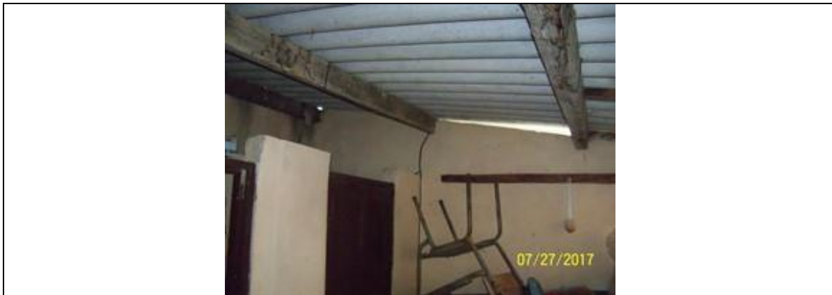
Área para rehabilitar o construir para el baño escolar, incluye la circulación cubierta