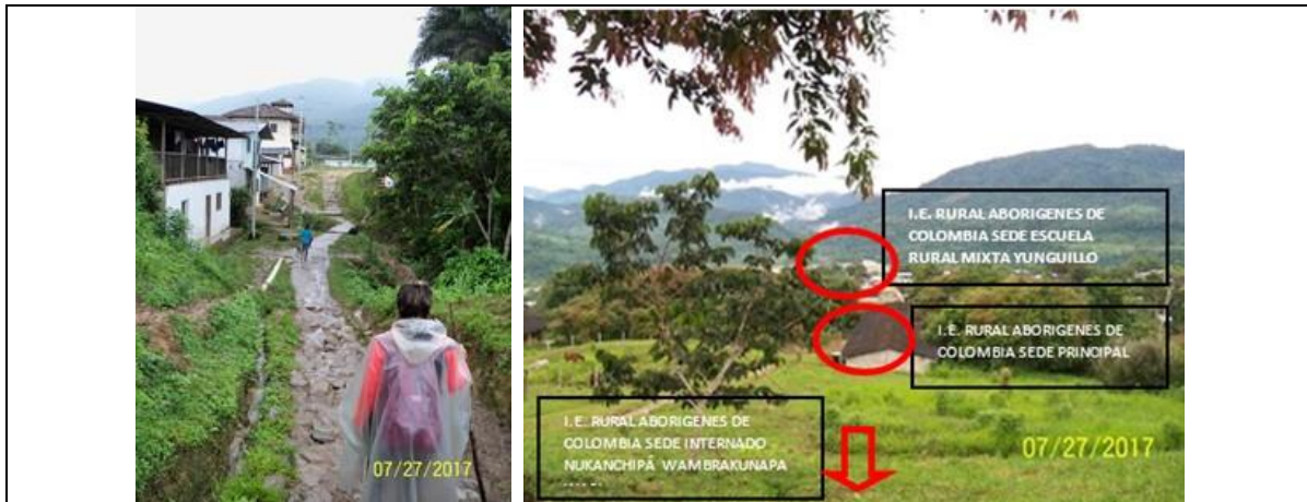
Estado del camilo de traslado de la IE Las Vegas hasta las Instituciones educativas ABORIGENES DE COLOMBIA. Las tres instituciones educativas se encuentra contiguas, con una distancia entre ellas de aproximadamente 500mt