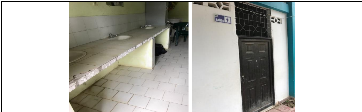
Baños: Baterías sanitarias a reponer.