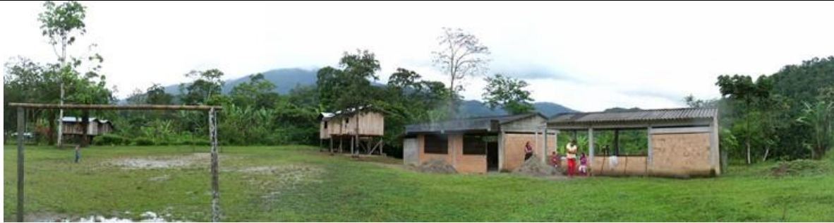
Panorámica del proyecto a intervenir, en la cual se visualiza los módulos existentes, el aula y comedor-cocina a intervenir