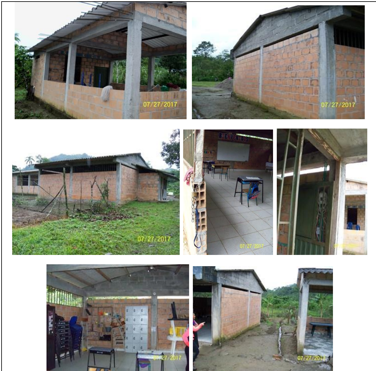
Modulo del aula escolar a intervenir y área de circulación existente.