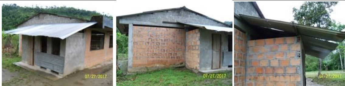
Batería de baños existentes y a reponer.