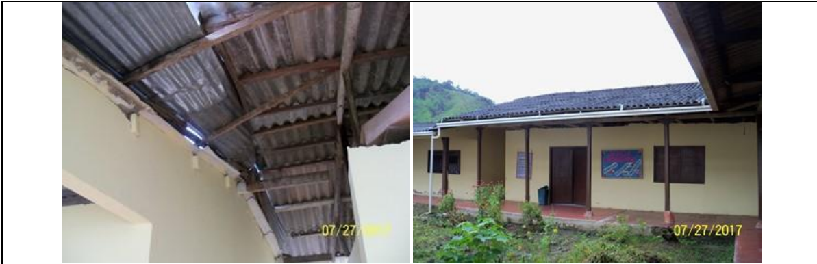
Área del módulo escolar, al cual se deberá realizar las actividades mínimas relacionadas en el alcance de éste proyecto