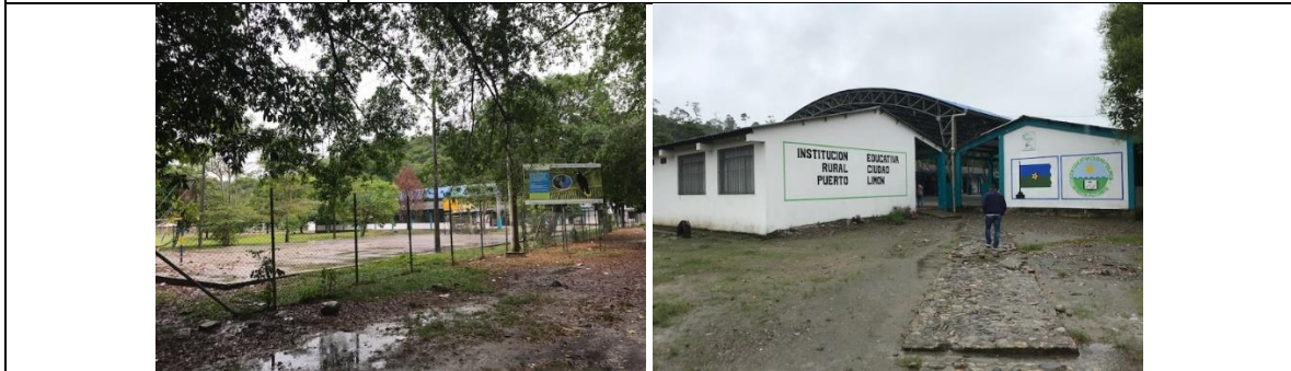
Accesibilidad a la Institución Educativa: De la vía que comunica Mocoa a Villa garzón - Puerto Asís, se desprende vía carreteable hasta la vereda el Limón, aprox. a 13 km. de la vía principal. Disponibilidad de servicios públicos.

I.E. RURAL ALTO AFAN SEDE 15 DE MAYO , presenta sana posesión, predio rural de propiedad del Municipio de Mocoa según Escritura Pública No. 522 del 1 de abril de 2011 otorgado por la de la N.U del Círculo de Mocoa, a la Escritura Pública No. 693 del 10 de abril de 2015 otorgado por la de la N.U del Círculo de Mocoa, y que se soporta en el Certificado de Libertad y Tradición del folio de M.I. No. 440-68980 del 21 de septiembre de 2017, expedido por la Oficina de Instrumentos Públicos de Mocoa.