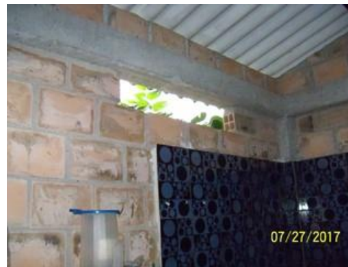
Modulo comedor – cocina, en donde se evidencia el área de comedor y de la cocina a intervenir.