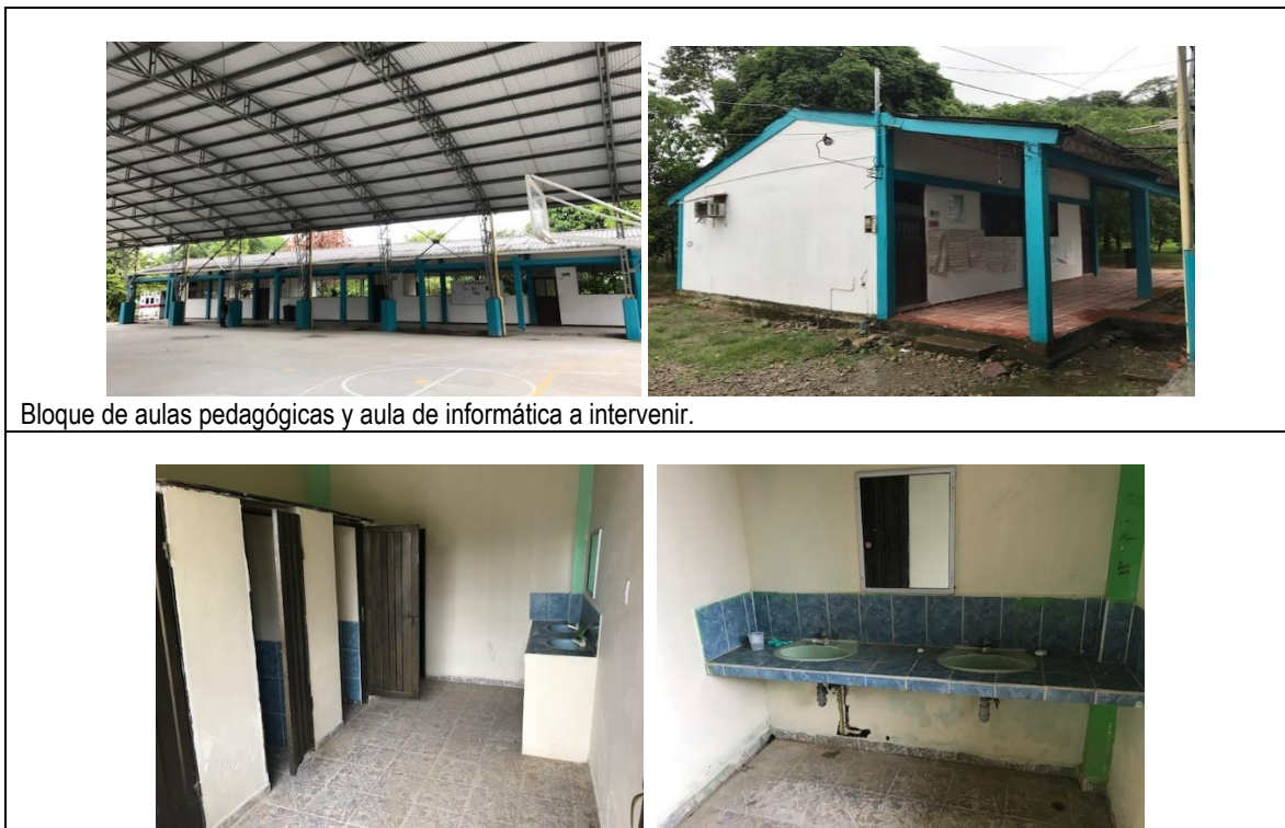
Bloque de aulas pedagógicas y aula de informática a intervenir.

Registro fotográfico del área a intervenir