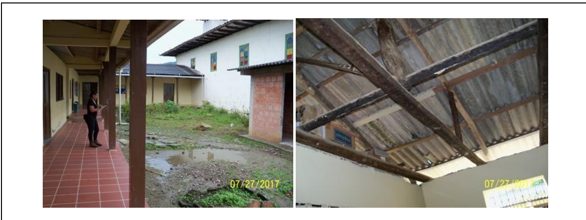
Registro fotográfico del Predio

I.E. RURAL ABORIGENES DE COLOMBIA SEDE ESCUELA RURAL MIXTA YUNGUILLO , predio rural del Municipio de Mocoa, sobre el cual se encuentra ubicado el Resguardo INGA DE YUNGUILLO, el cual se encuentra bajo medida de protección a solicitud de la comunidad indígena (oficio DTPM1-00013 de enero 16 de 2017 expedido por la UNIDAD ADMINISTRATIVA ESPECIAL DE GESTION DE RESTITUCION DE TIERRAS DESPOJADAS). Soportado en el Acuerdo No. 362 del 5 de mayo de 2015, expedido por el Instituto Colombiano de Desarrollo Rural. Certificado de Libertado y tradición con Matrícula Inmobiliaria No. 440-70783 de la Oficina de Registro de Instrumentos Públicos de Mocoa.