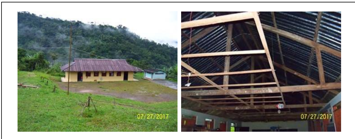
Registro fotográfico del Predio

I.E. RURAL ABORIGENES DE COLOMBIA SEDE ESCUELA RURAL MIXTA OSOCOCHA , predio rural del Municipio de Mocoa, sobre el cual se encuentra ubicado el Resguardo INGA DE YUNGUILLO, el cual se encuentra bajo medida de protección a solicitud de la comunidad indígena (oficio DTPM1-00013 de enero 16 de 2017 expedido por la UNIDAD ADMINISTRATIVA ESPECIAL DE GESTION DE RESTITUCION DE TIERRAS DESPOJADAS). Soportado en el Acuerdo No. 362 del 5 de mayo de 2015, expedido por el Instituto Colombiano de Desarrollo Rural. Certificado de Libertado y tradición con Matrícula Inmobiliaria No. 440-70783 de la Oficina de Registro de Instrumentos Públicos de Mocoa.