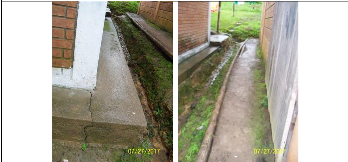
Áreas de circulación intermedias las cuales deberán ser contempladas para su intervención y por las cuales se deberá cruzar el sistema de conducción de las aguas de escorrentía superficial.