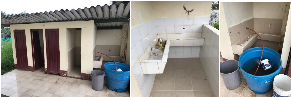
Baños: Baterías sanitarias a reponer.