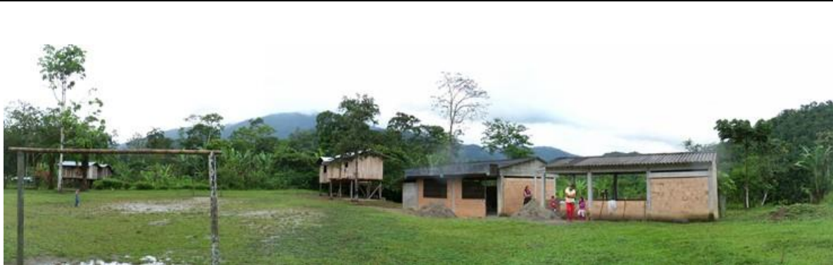
Panorámica del proyecto a intervenir, en la cual se visualiza los módulos existentes, el aula y comedor-cocina a intervenir