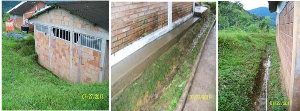
Áreas contiguas a la edificación y a las acules se les debe realizar el diagnóstico y diseños del sistema de recolección y conducción del agua de escorrentía superficial.

I.E. RURAL ABORIGENES DE COLOMBIA SEDE ESCUELA RURAL MIXTA YUNGUILLO , predio rural del Municipio de Mocoa, sobre el cual se encuentra ubicado el Resguardo INGA DE YUNGUILLO, el cual se encuentra bajo medida de protección a solicitud de la comunidad indígena (oficio DTPM1-00013 de enero 16 de 2017 expedido por la UNIDAD ADMINISTRATIVA ESPECIAL DE GESTION DE RESTITUCION DE TIERRAS DESPOJADAS). Soportado en el Acuerdo No. 362 del 5 de mayo de 2015, expedido por el Instituto Colombiano de Desarrollo Rural. Certificado de Libertado y tradición con Matrícula Inmobiliaria No. 440-70783 de la Oficina de Registro de Instrumentos Públicos de Mocoa.