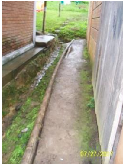
Áreas de circulación intermedias las cuales deberán ser contempladas para su intervención y por las cuales se deberá cruzar el sistema de conducción de las aguas de escorrentía superficial.