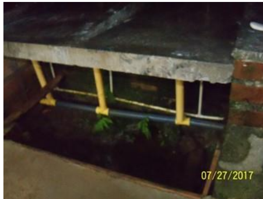
Área para diseñar y construir la zona de lavandería debidamente cubierta