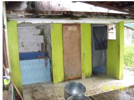
Área de la batería existente, ubicada en el comedor, ya la cual se deberá realizar su construcción, conforme al resultado del diagnóstico.