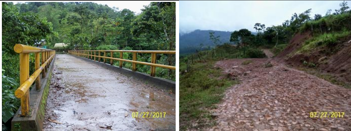
Camino de salida desde las Instituciones educativas ABORIGENES DE COLOMBIA al sitio del punto de retorno "La Punta".

I.E. RURAL PUEBLO VIEJO SEDE PRINCIPAL , presenta sana posesión por más de 10 años, predio rural de propiedad del Municipio de Mocoa según Escritura Pública No. 1865 del 22 de noviembre de 2006 de la N.U del Círculo de Mocoa, a la Escritura Pública No. 35 del 15 de enero de 2000 de la N.U del Círculo de Mocoa y que se soporta en el Certificado de Libertad y Tradición del folio de M.I. No. 440-54064 del 31 de agosto de 2017, expedido por la Oficina de Instrumentos Públicos de Mocoa.