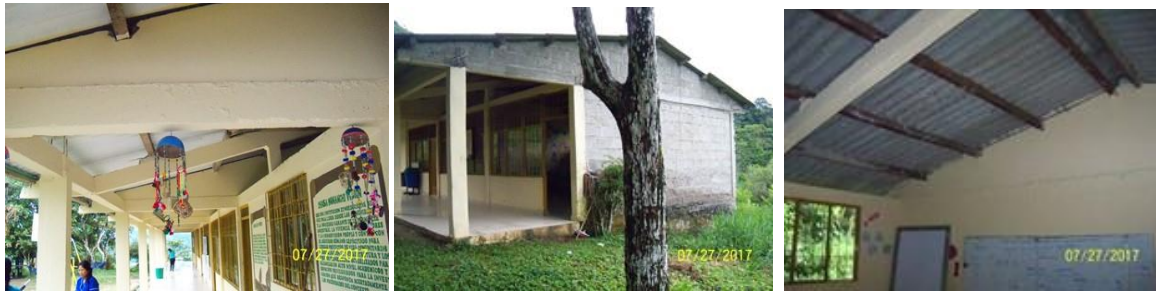
Área adecuación modulo aulas educativas, en la cual se visualiza la cubierta y muros a intervenir