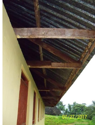
Área de la única aula escolar, a la cual se debe realizar la cambio de la cubierta y demás actividades mínimas indicadas en el alcance del proyecto