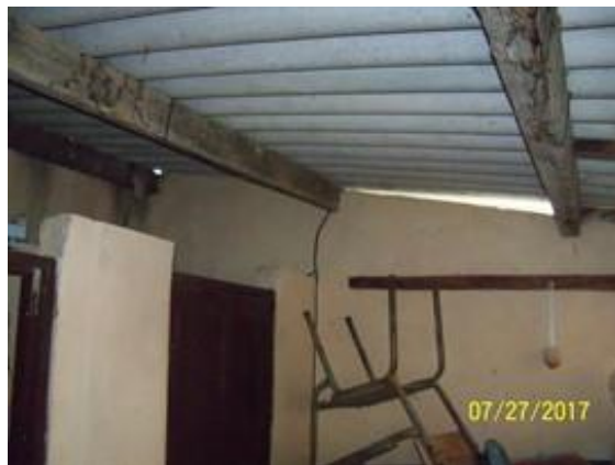
Área para rehabilitar o construir para el baño escolar, incluye la circulación cubierta