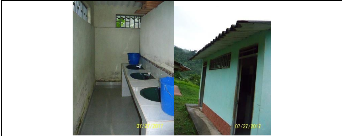
Módulo de la batería sanitaria a intervenir.