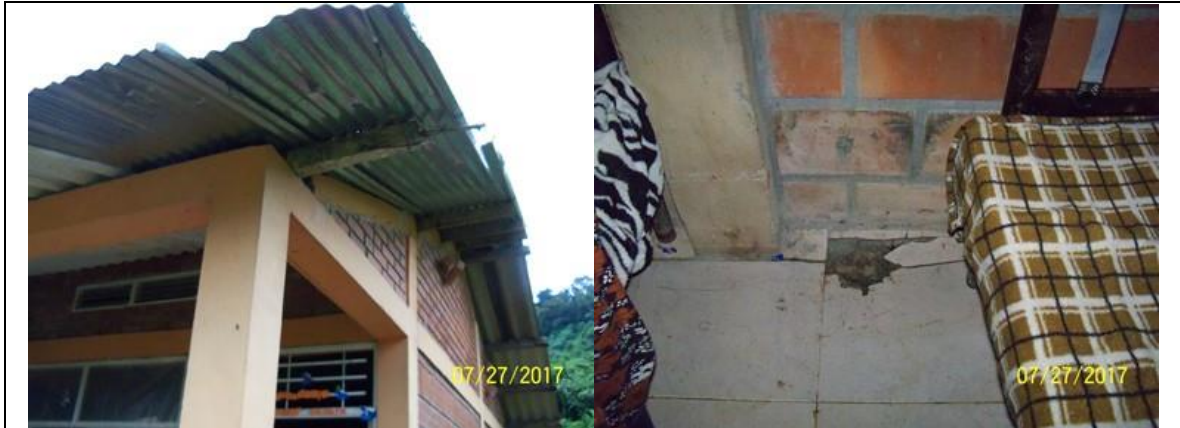
Estado de los dormitorios de niñas y niños, a los cuales se les debe diagnosticar y ejecutar las actividades que permitan recuperar estas áreas y garantizar las condiciones óptimas para su correcta operación.