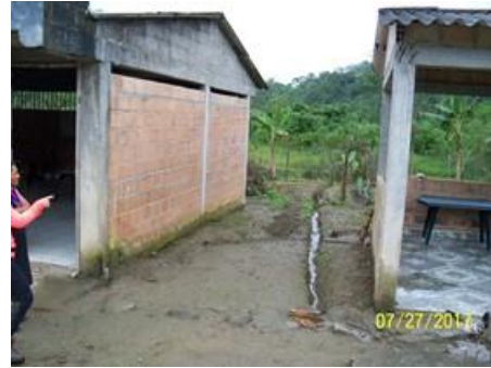
Modulo del aula escolar a intervenir y área de circulación existente.