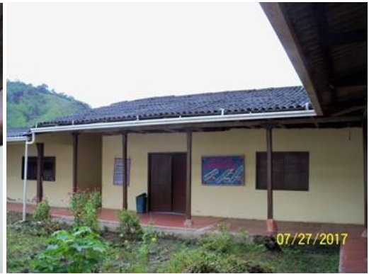
Área del módulo escolar, al cual se deberá realizar las actividades mínimas relacionadas en el alcance de éste proyecto