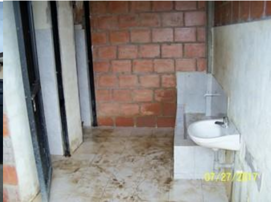
Módulo de la batería de balos existentes, a las cuales se les debe realizar las actividades mínimas indicadas en el alcance de éste proyecto.