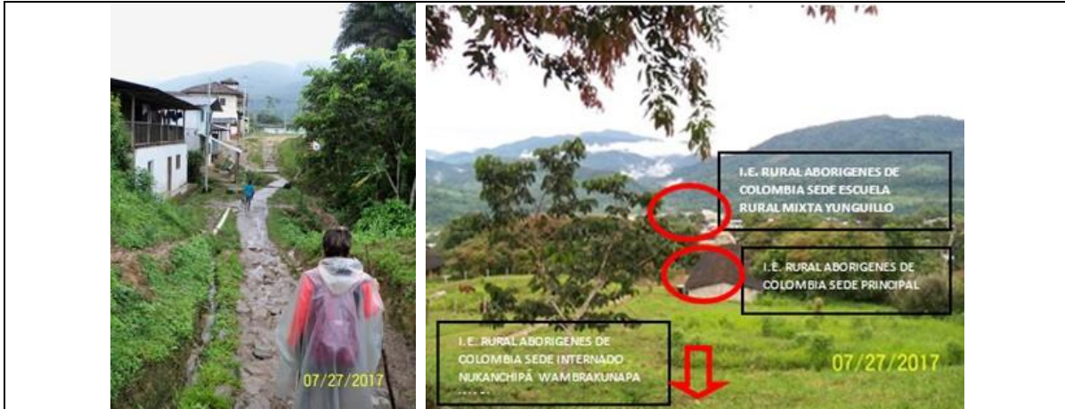
Estado del camilo de traslado de la IE Las Vegas hasta las Instituciones educativas ABORIGENES DE COLOMBIA. Las tres instituciones educativas se encuentra contiguas, con una distancia entre ellas de aproximadamente 500mt