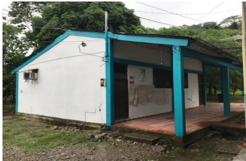
Bloque de aulas pedagógicas y aula de informática a intervenir.