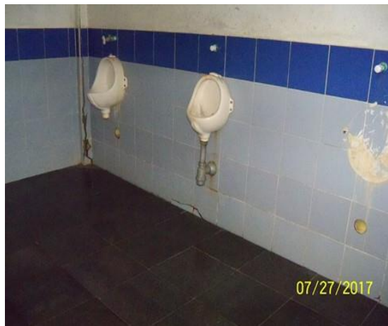
Estado actual de la batería sanitaria, en la cual se deberá realizar intervención indicada en los alcances.