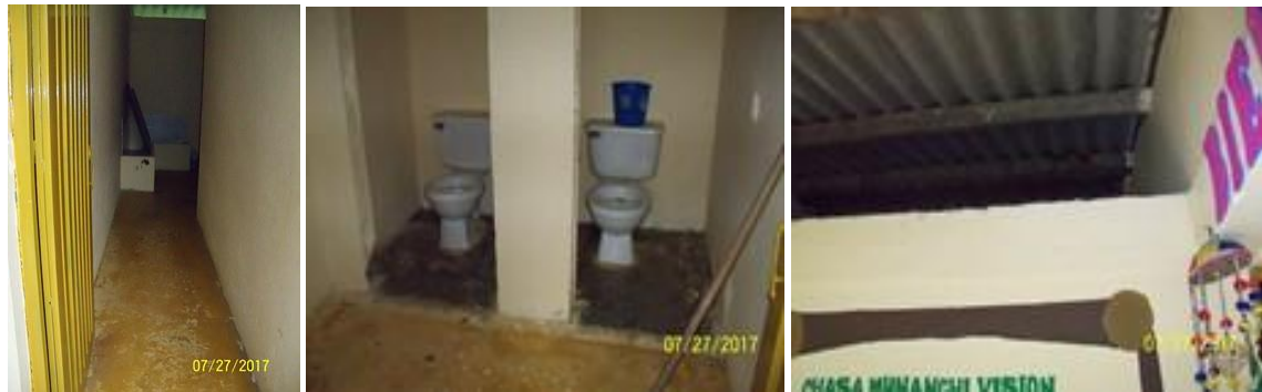
Áreas a intervenir e integrar en una misma para sala de profesores con su respectivo baño

I.E. RURAL ABORIGENES DE COLOMBIA SEDE INTERNADO NUKANCHIPÁ WAMBRAKUNAPA WASI , predio rural del Municipio de Mocoa, sobre el cual se encuentra ubicado el Resguardo INGA DE YUNGUILLO, el cual se encuentra bajo medida de protección a solicitud de la comunidad indígena (oficio DTPM1-00013 de enero 16 de 2017 expedido por la UNIDAD ADMINISTRATIVA ESPECIAL DE GESTION DE RESTITUCION DE TIERRAS DESPOJADAS). Soportado en el Acuerdo No. 362 del 5 de mayo de 2015, expedido por el Instituto Colombiano de Desarrollo Rural. Certificado de Libertado y tradición con Matrícula Inmobiliaria No. 440-70783 de la Oficina de Registro de Instrumentos Públicos de Mocoa.