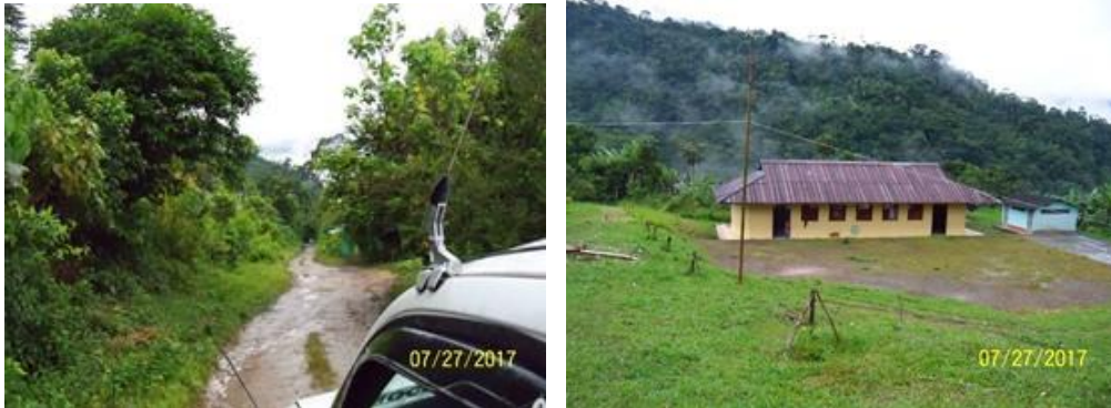
Vía de acceso desde la vía panamericana al sitio conocido como la Punta, en donde se encuentra la IE OSOCOHA.