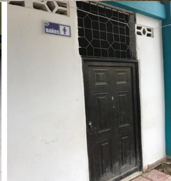
Baños: Baterías sanitarias a reponer.