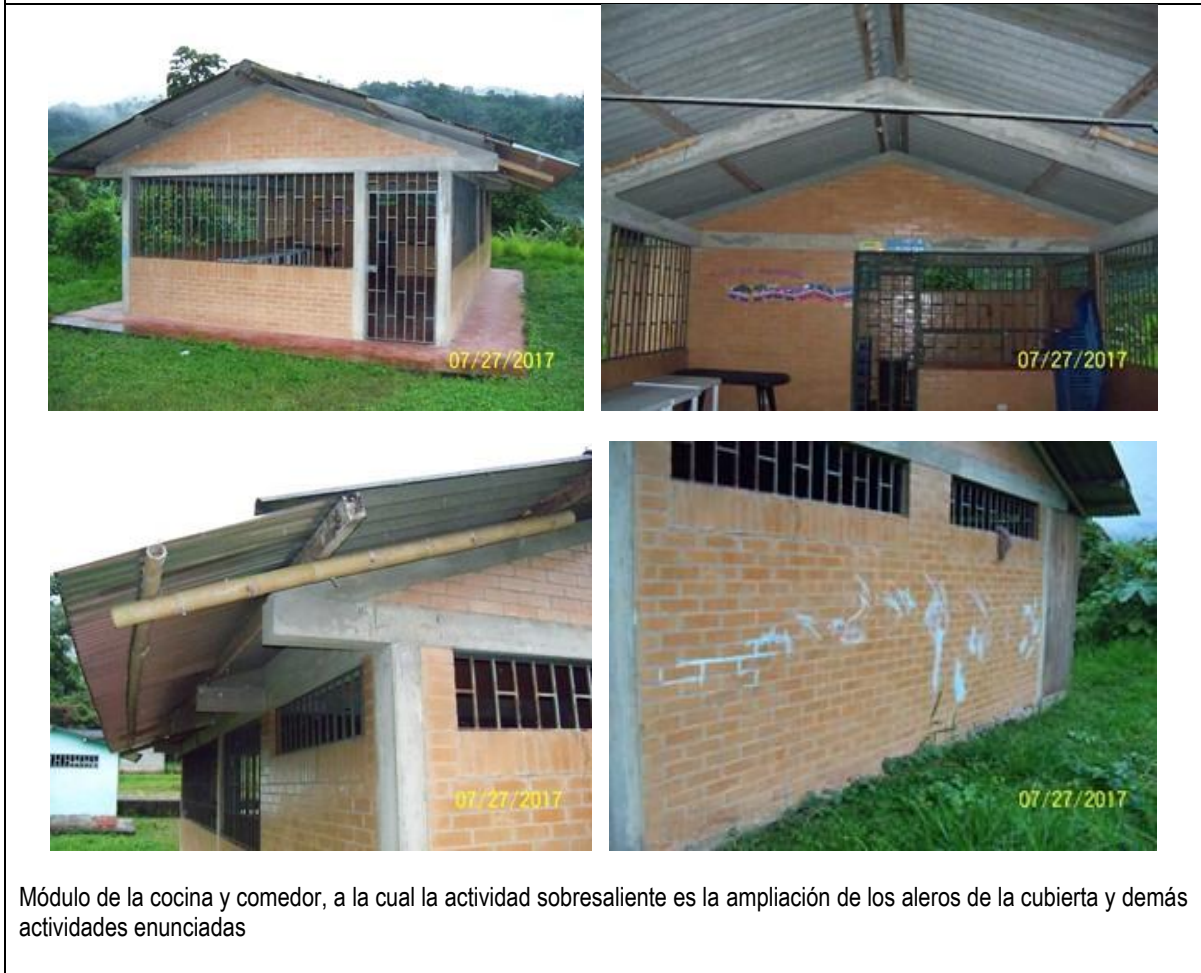
Módulo de la cocina y comedor, a la cual la actividad sobresaliente es la ampliación de los aleros de la cubierta y demás actividades enunciadas