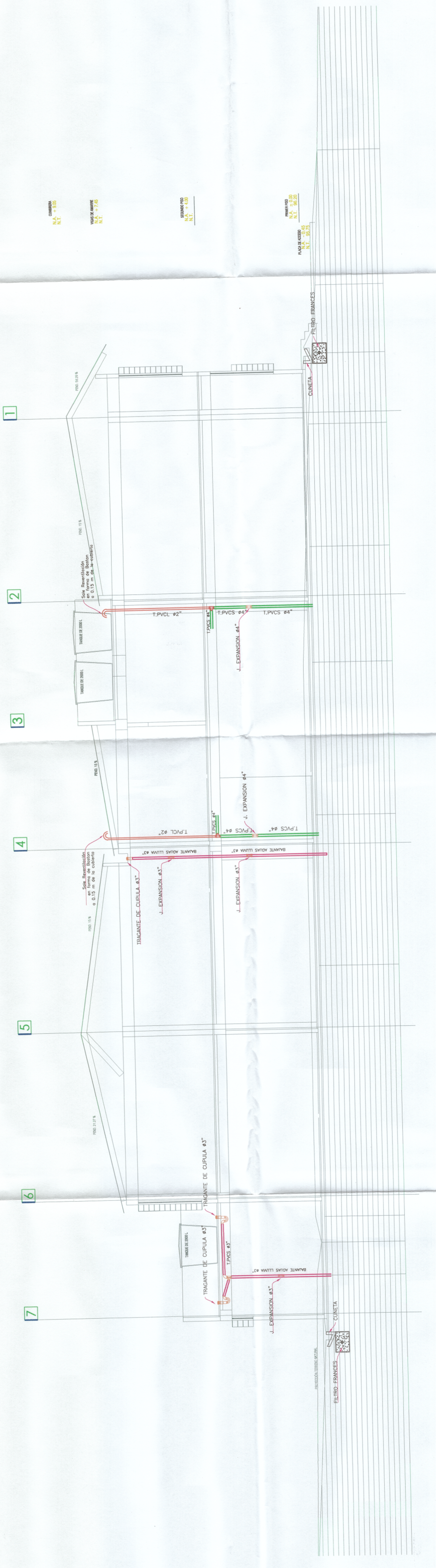
ESQUEMA VERTICAL Sin Escala