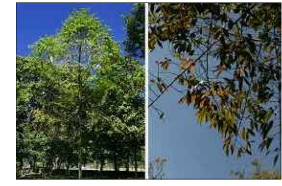
IMAGEN ARBOL ABARCO