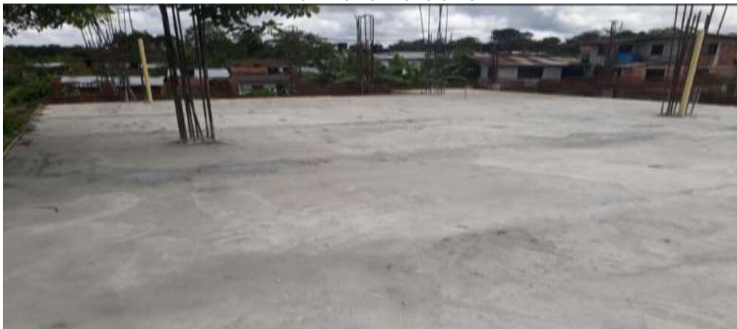
PANORAMICA ESTADO ACTUAL OBRA

Los anteriores proyectos podrán ser modificados o adicionado alguno o más, en este último caso se evaluará bajo las condiciones técnicas y económicas presentadas por el contratista en los demás proyectos adjudicados.