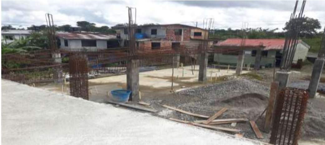
PANORAMICA ESTADO ACTUAL OBRA