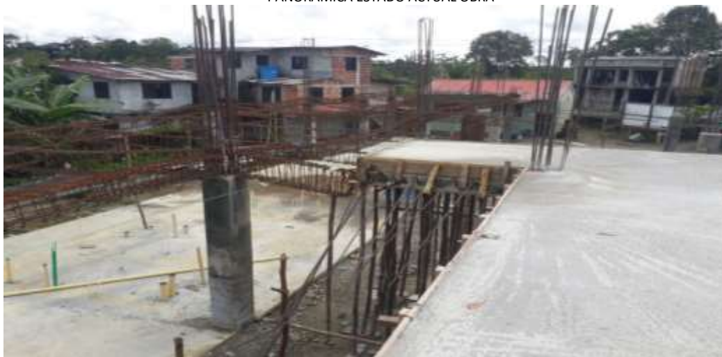
PANORAMICA ESTADO ACTUAL OBRA