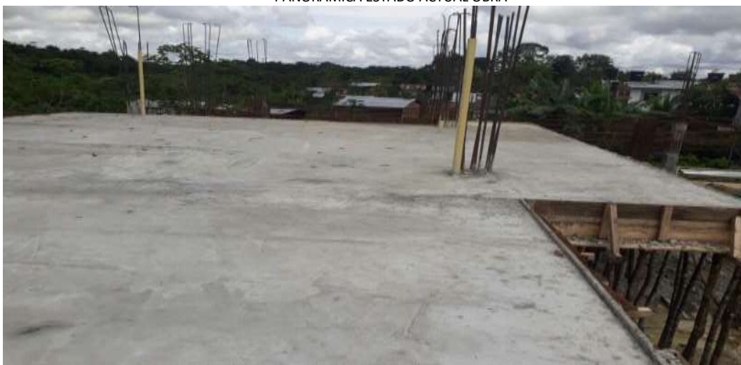
PANORAMICA ESTADO ACTUAL OBRA