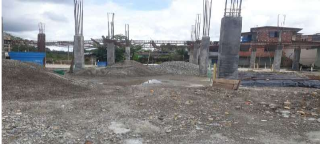
PANORAMICA ESTADO ACTUAL OBRA