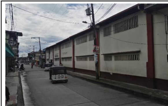
Fotografía 1. Vista frontal de la IE.