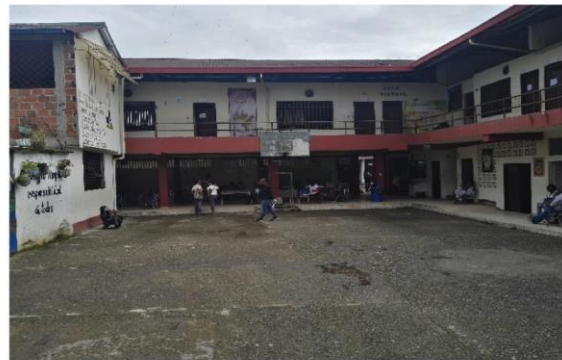
Fotografía 2. Estado actual Infraestructura Educativa