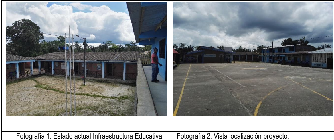
Fotografía 1. Estado actual Infraestructura Educativa.