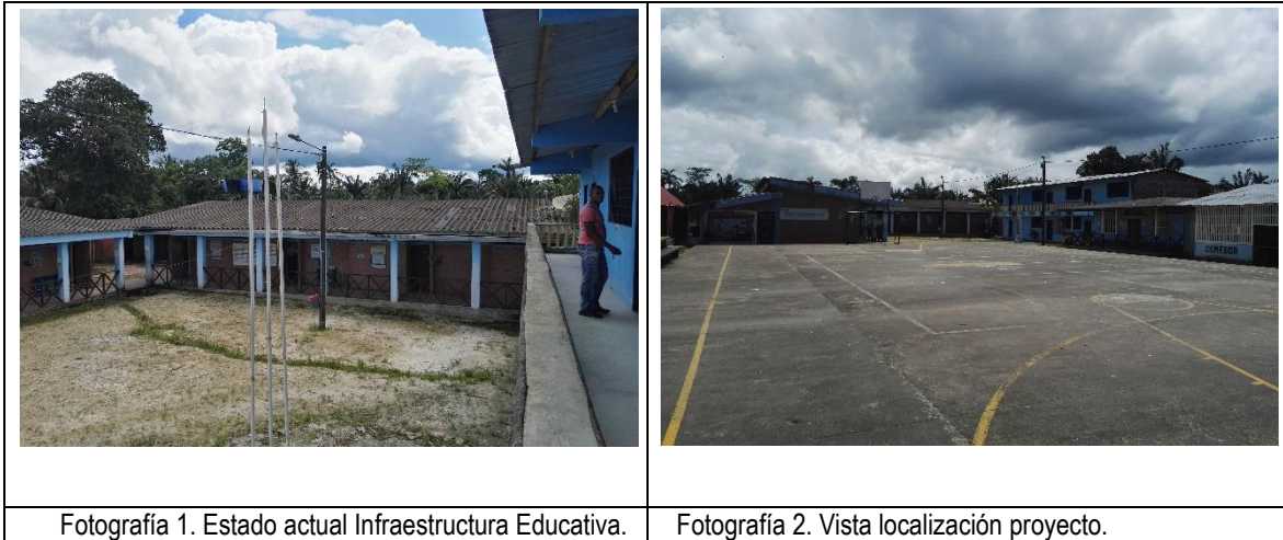
Fotografía 1. Estado actual Infraestructura Educativa.