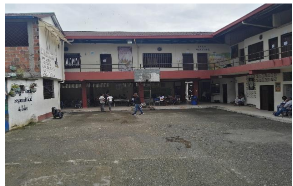
Fotografía 2. Estado actual Infraestructura Educativa