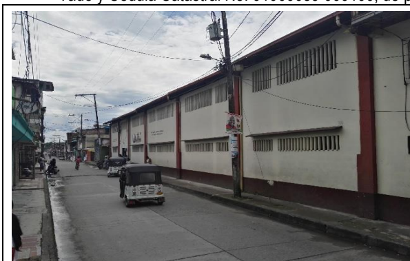
Fotografía 1. Vista frontal de la IE.