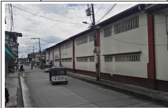
Fotografía 1. Vista frontal de la IE.