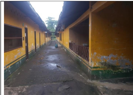
Fotografía 1. Estado actual Infraestructura Educativa.