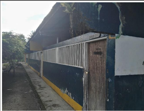
Fotografía 2. Estado actual Infraestructura Educativa