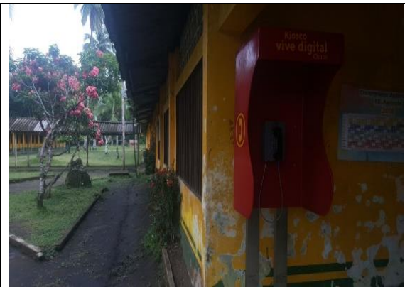
Fotografía 2. Vista localización proyecto.