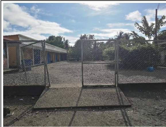
Fotografía 1. Vista frontal de la IE.