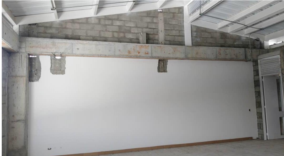
BAÑO NIÑAS TERCER PISO