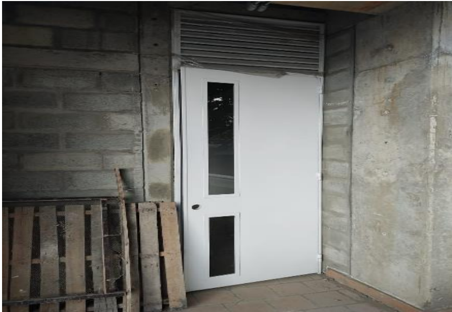
AULA N° 2 SEGUNDO PISO