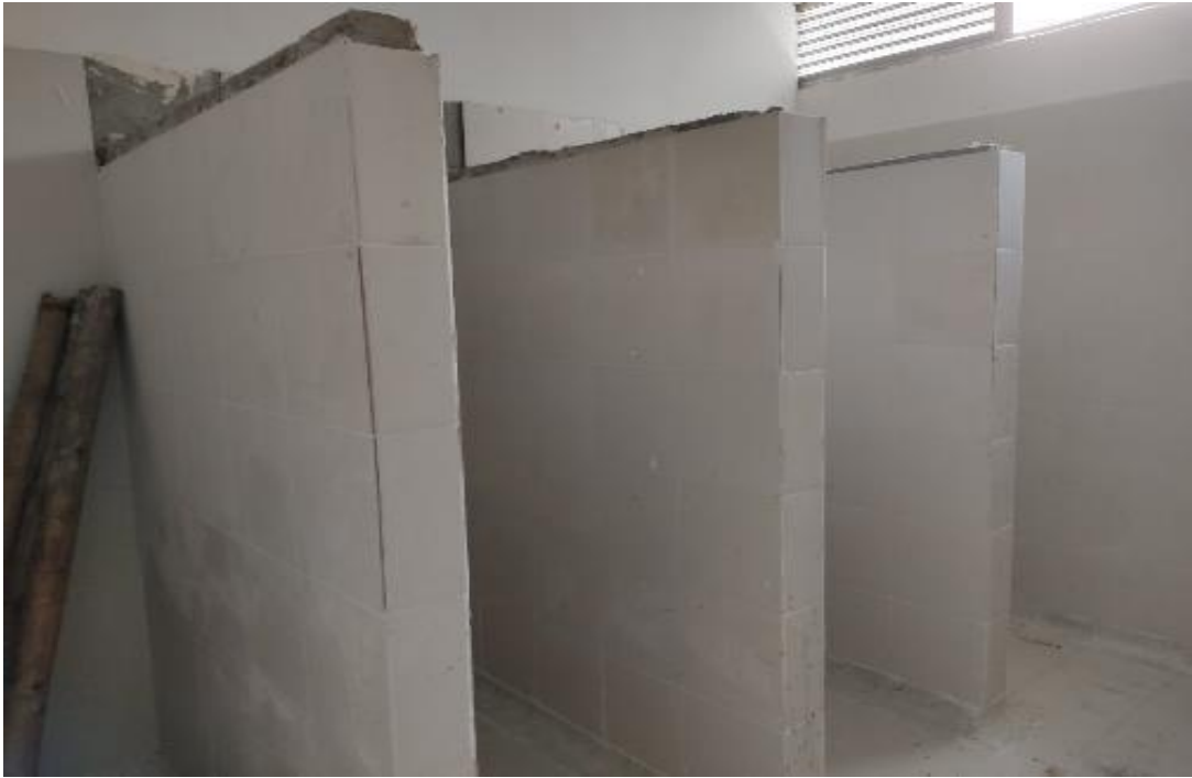
BAÑO NIÑO SEGUNDO PISO