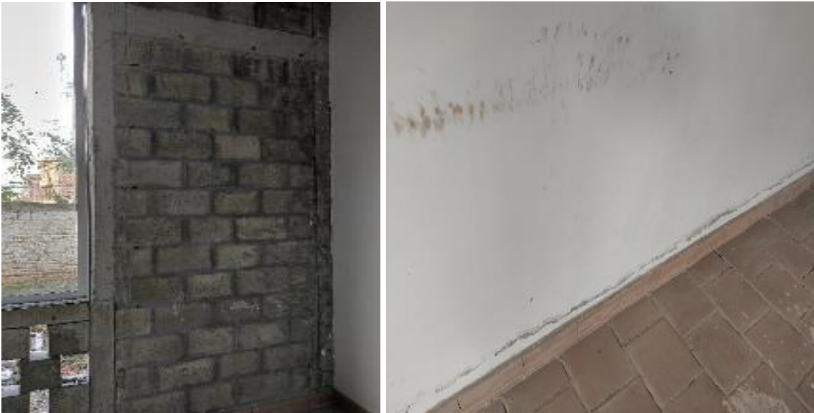
AULA Nº 3 PRIMER PISO