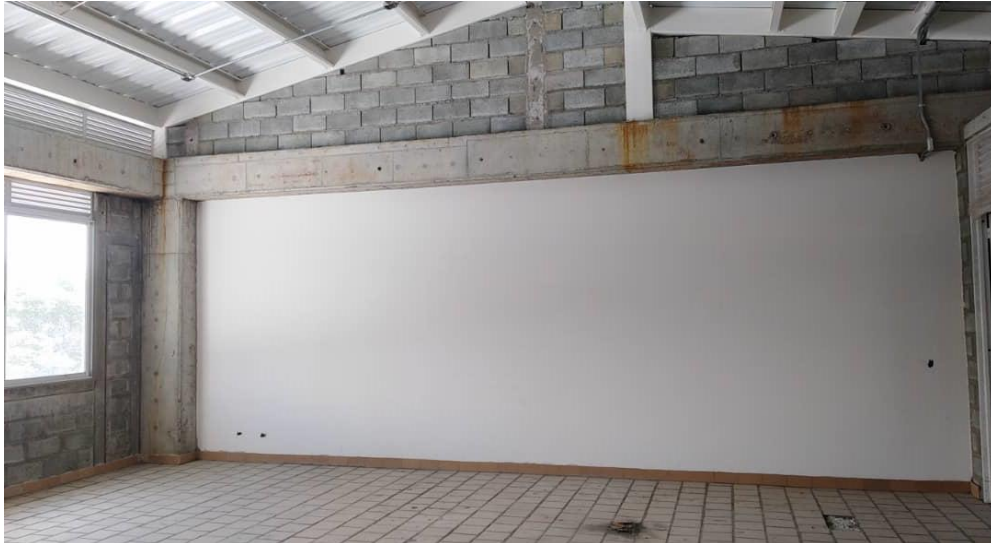
AULA 5 TERCER PISO