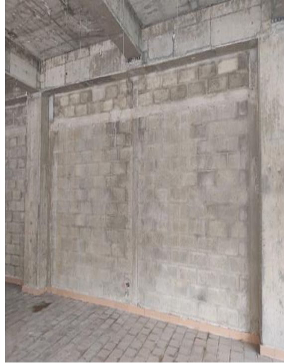
BAÑO NIÑAS PRIMER PISO