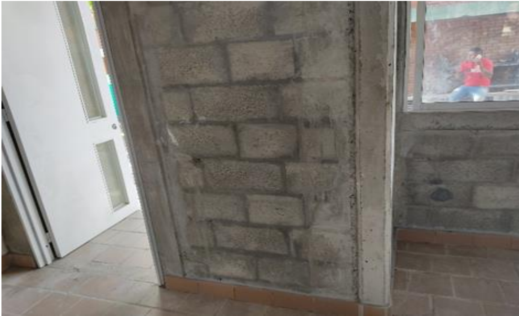
AULA N° 2 PRIMER PISO