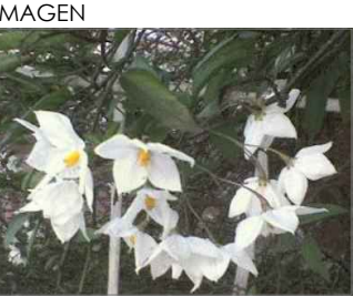
PLANTA ENREDADERA MANTO DE MARIA (B. LAXUM) 83.50 m2 AREA APROXIMADA