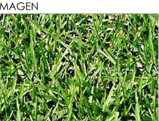
PLANTA CESPED KIKUYO 122.75 m2 AREA