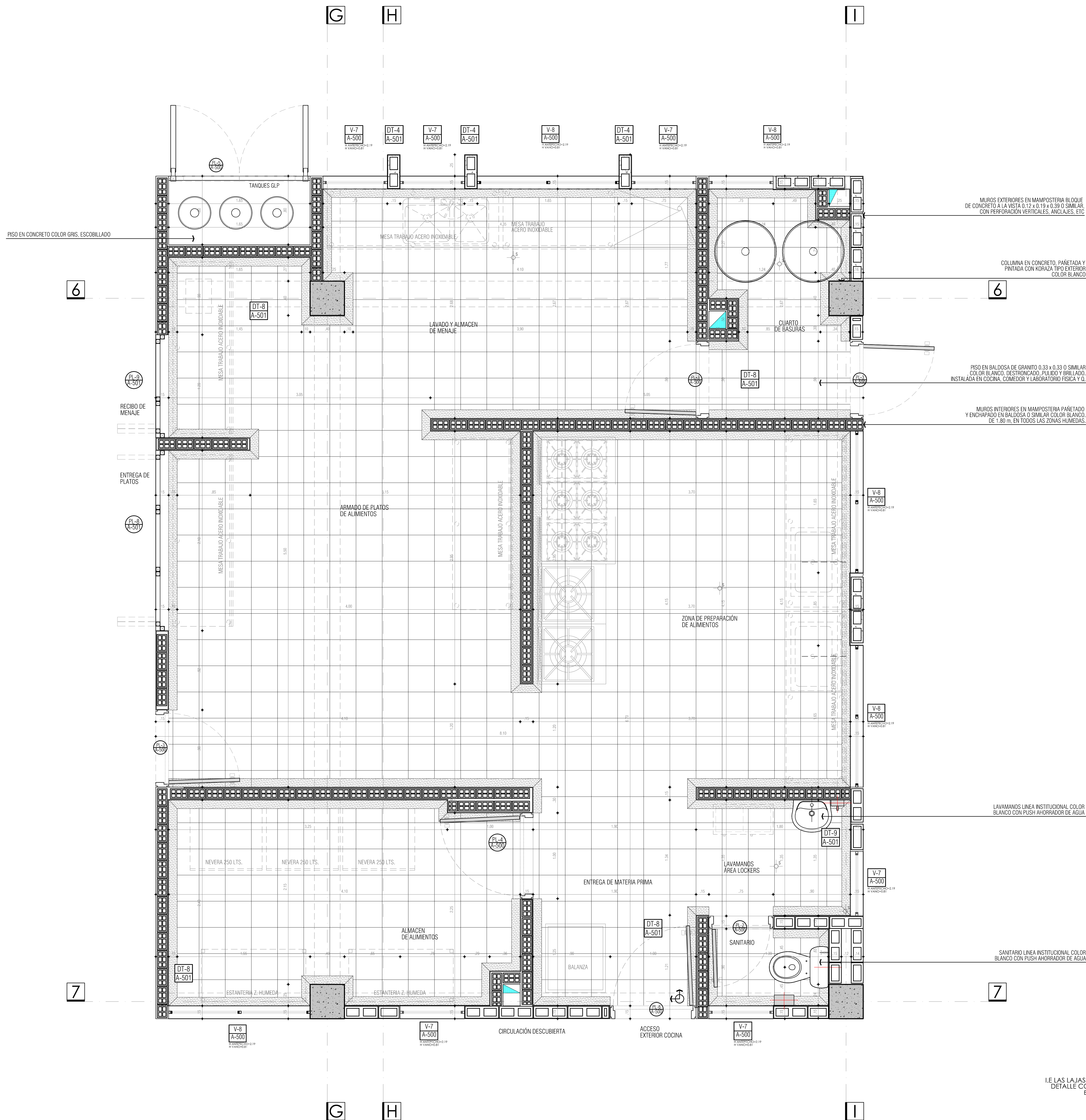
I.E. LAS LAJAS - IPIALES DETALLE COMEDOR ESC. 1 _ 20