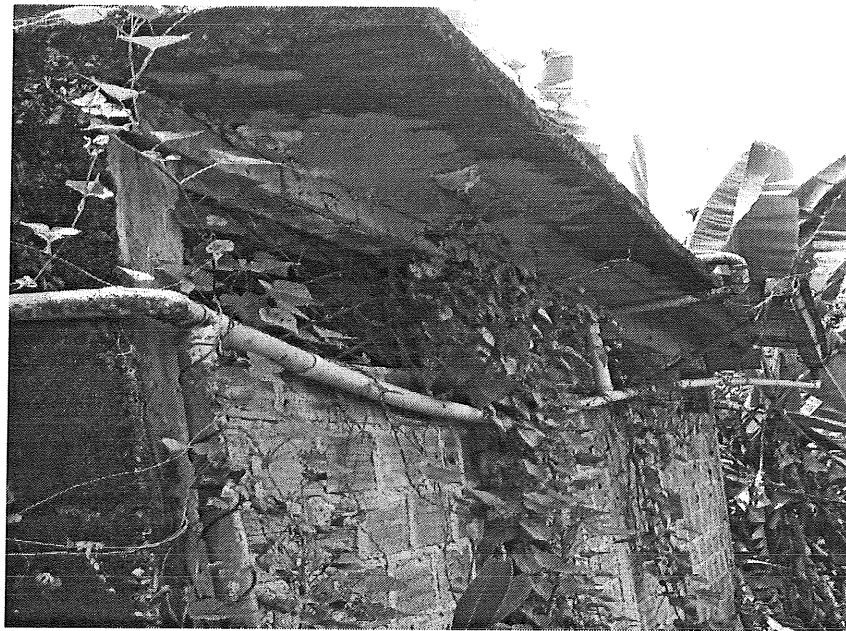
Foto 4. Estado de conexiones de aguas lluvia hacia tanque.