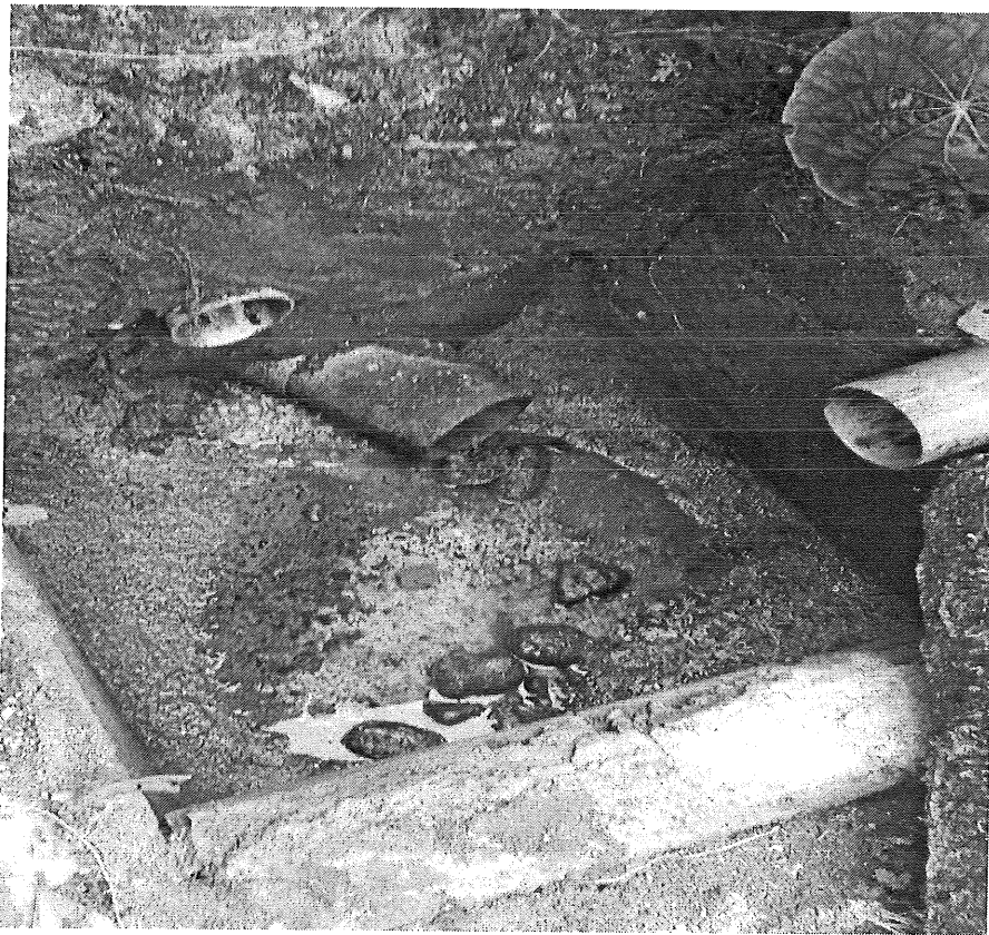
Foto 2. Caja de aguas negras existente.

El alcantarillado existente es exclusivo para las aguas negras, las aguas lluvias, que no son captadas para el tanque de recolección, drenan por escorrentía hacia la vía y hacia las zonas verdes.