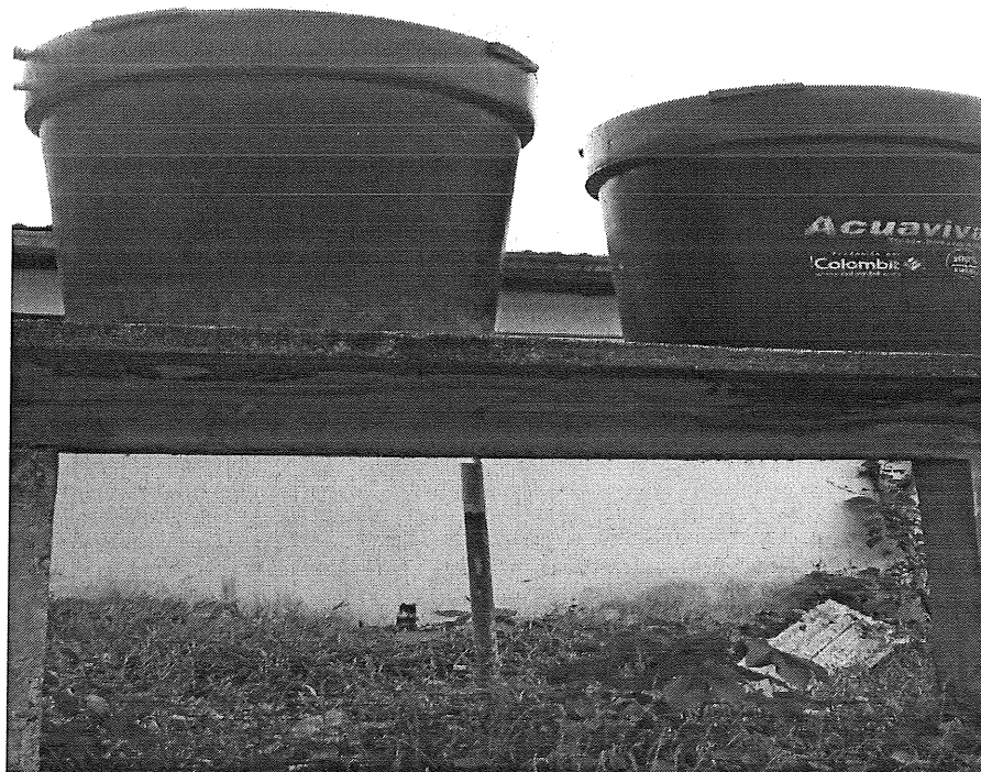
Foto 1. Tanques plásticos elevados recolectores de aguas lluvia

El suministro del agua potable esta a cargo de la administración municipal de Unión Panamericana.