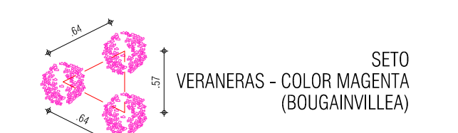
SETO VERANERAS - COLOR MAGENTA (BOUGAINVILLEA) SIMBOLO SETO VERANERAS

NOTA: LOS ARBOLES PLANTADOS TENDRAN UNA ALTURA MINIMA DE 1.2 m. ■ REJILLA EDIFICACION PROYECTADA