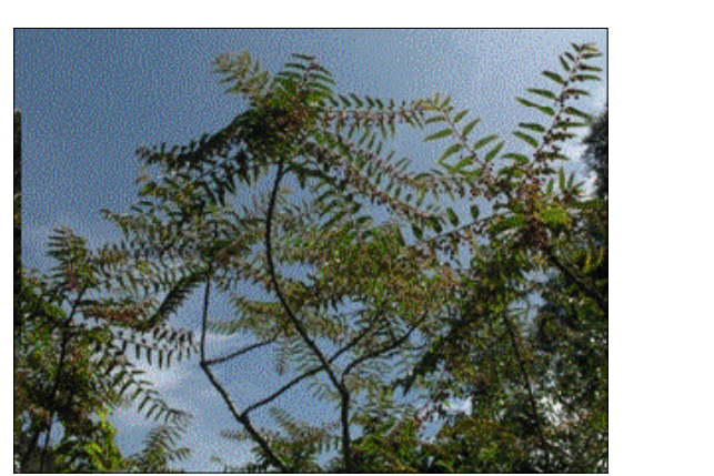
IMAGEN ARBOL CEDRELO