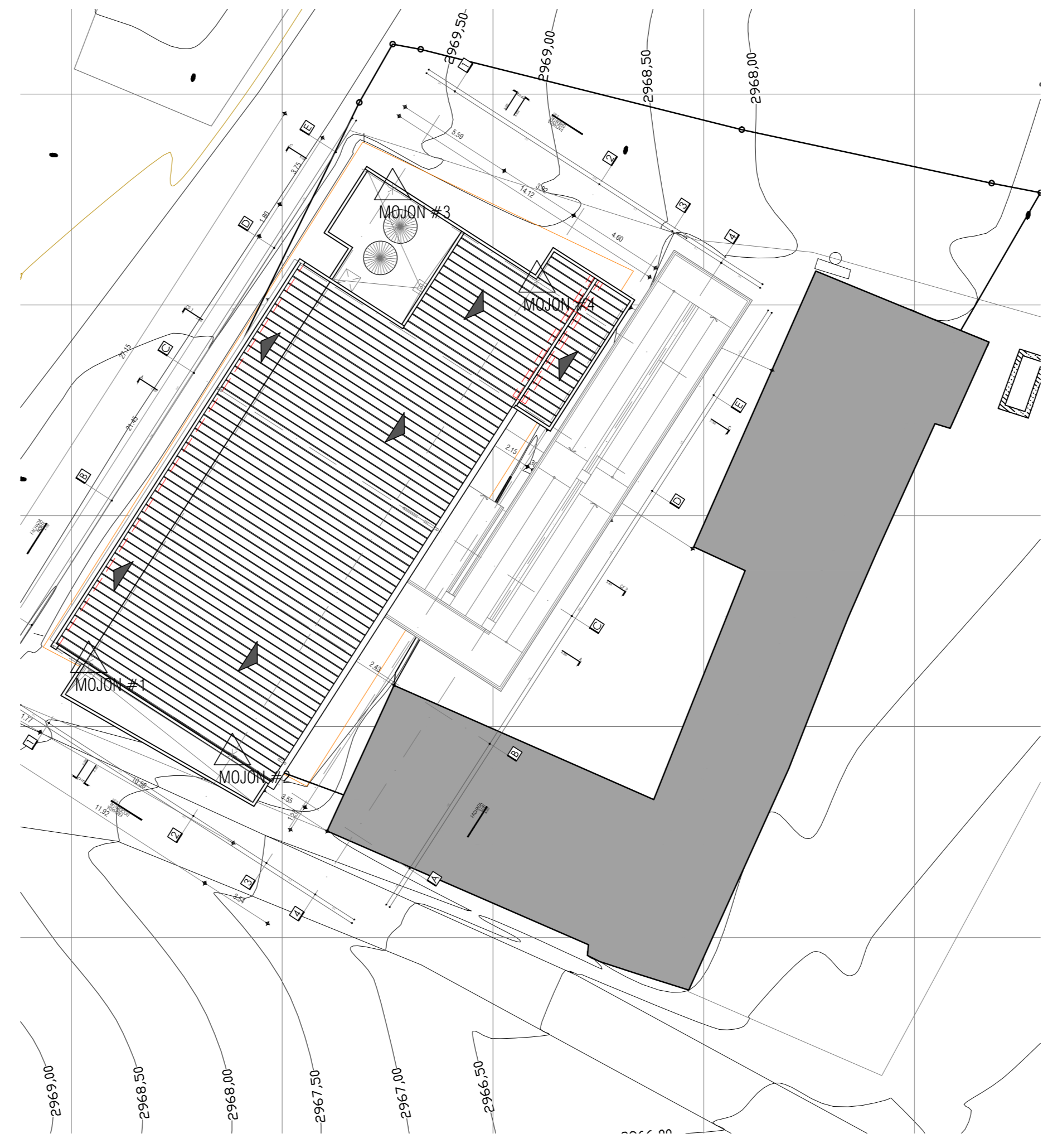
I.E. SOCORRO SAN GABRIEL PLANTA DE MOJONES ESC 1_200