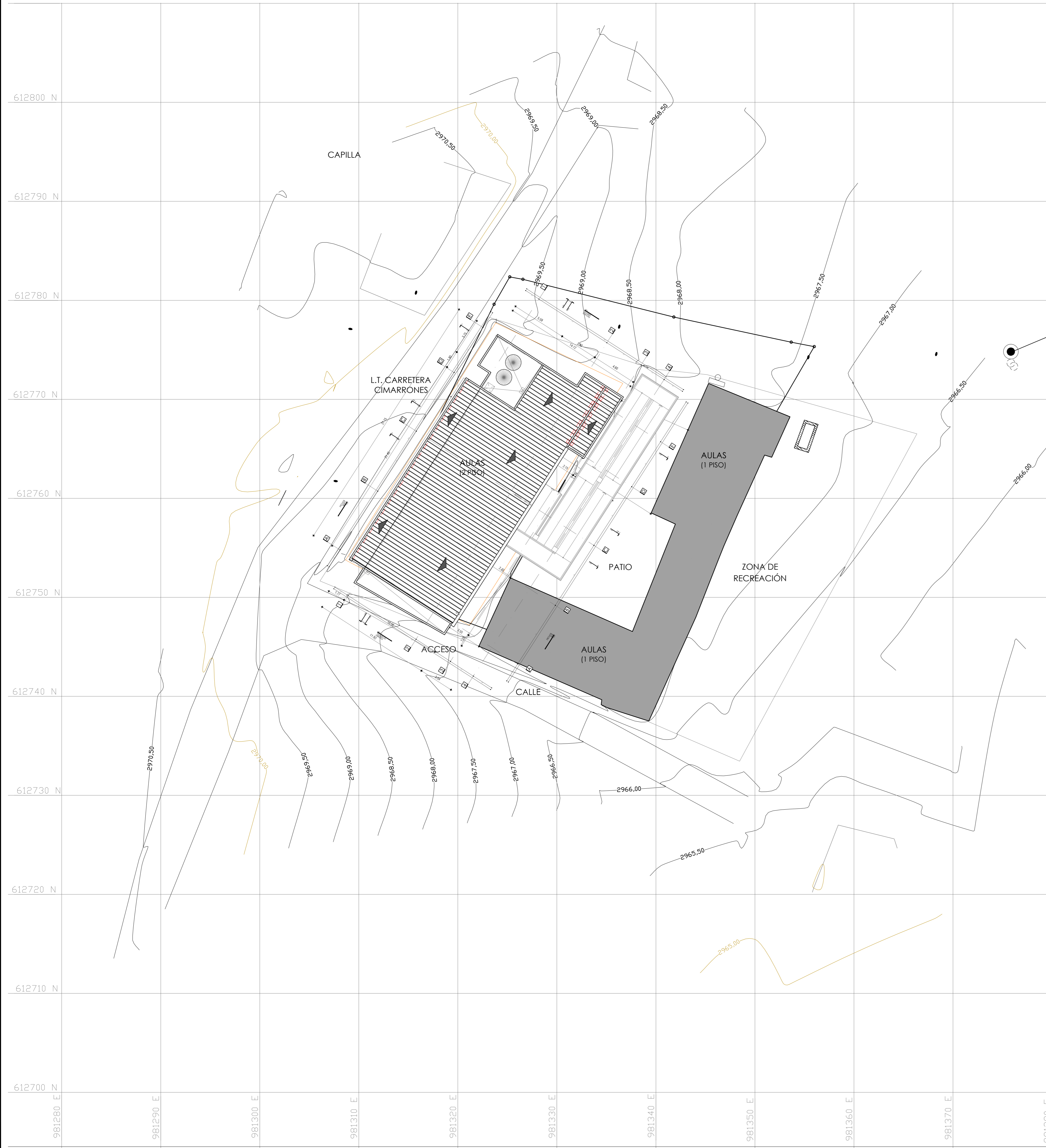
I.E. SOCORRO SAN GABRIEL PLANTA LOCALIZACIÓN ESC 1_200