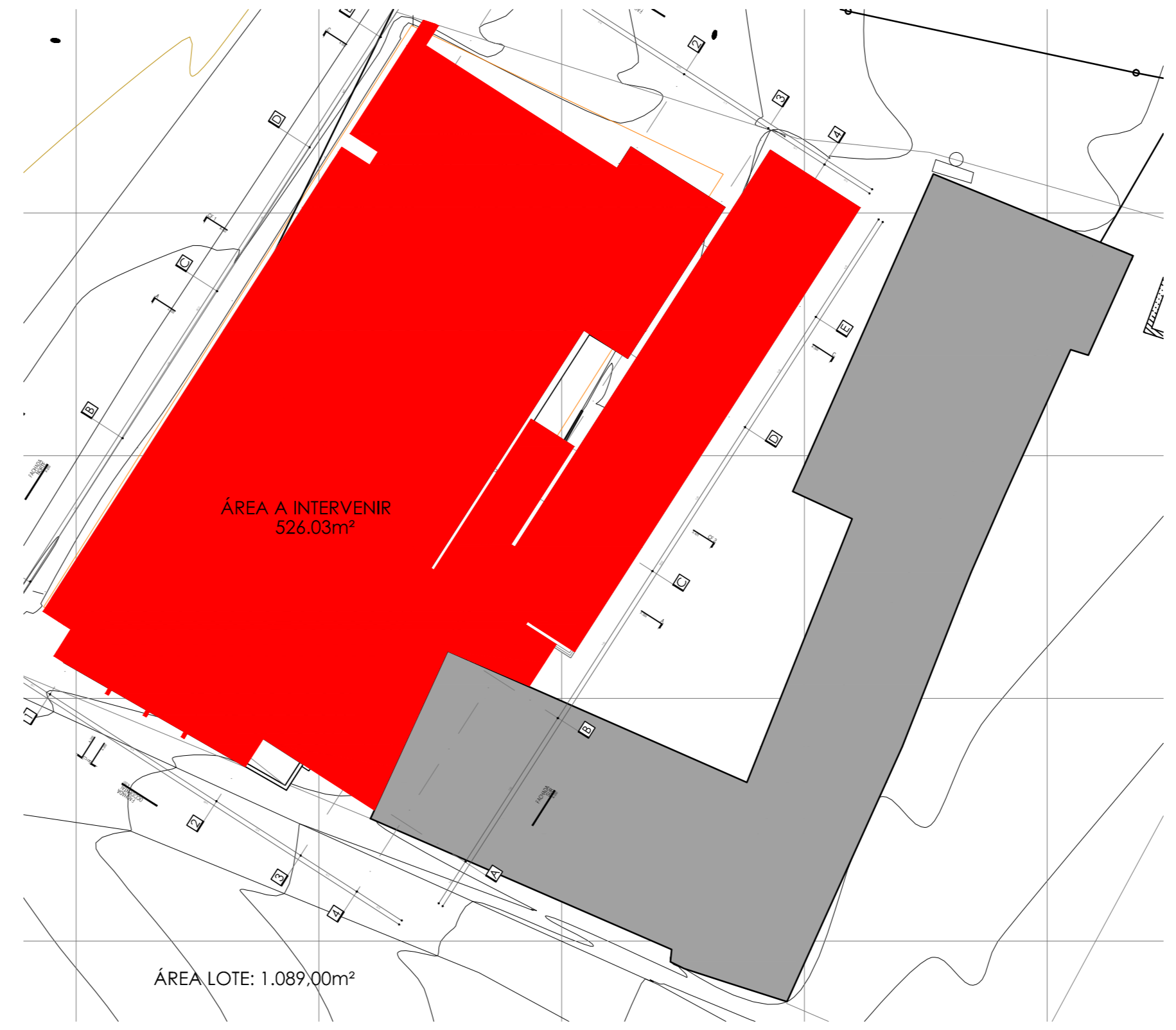
ÁREA LOTE: 1.089,00m²