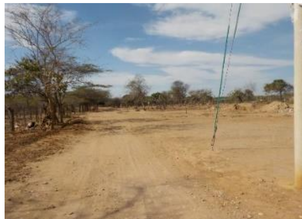
Foto predio Los Arrayanes o Recreo. Matricula inmobiliaria N° 212-56792