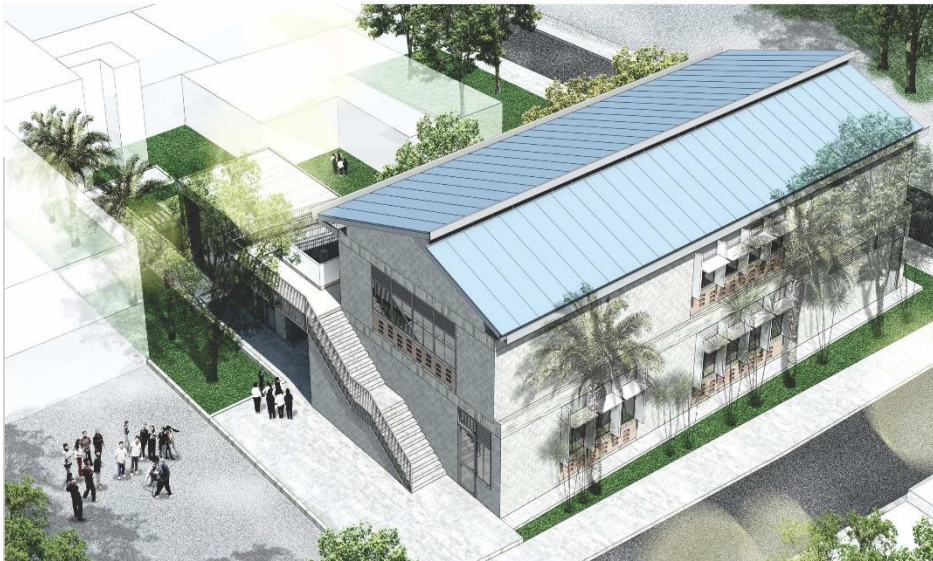
Proyección estudios y diseños del proyecto.

Lote identificado bajo la Matrícula Inmobiliaria No. 370-742053 de Jamundí, de propiedad del MUNICIPIO DE JAMUNDÍ – VALLE DEL CAUCA.