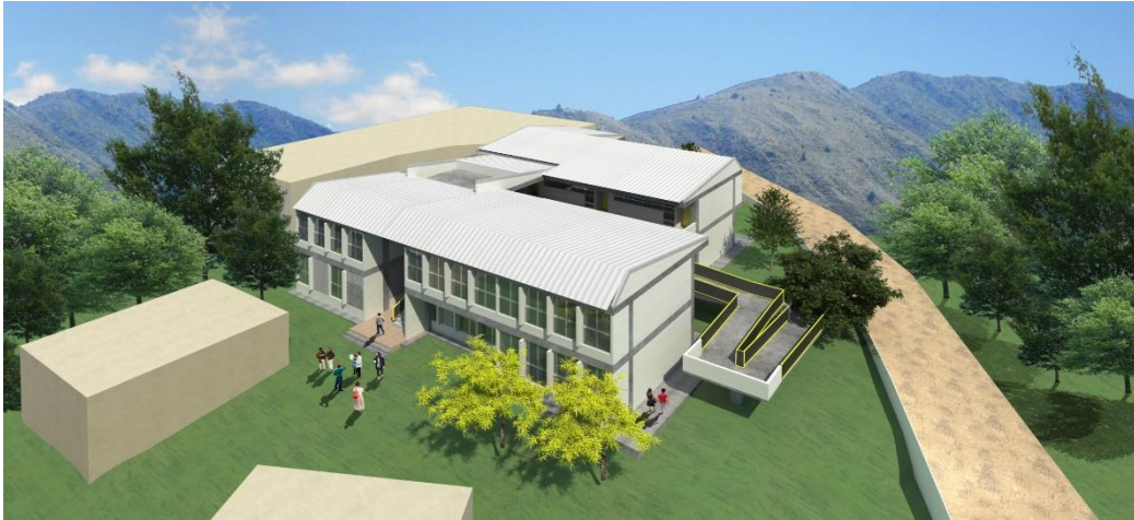
Proyección estudios y diseños del proyecto.

Pública No. 401 del 11 de diciembre de 2012 del Círculo de Unión Panamericana, de propiedad del MUNICIPIO DE Unión Panamericana – Choco.