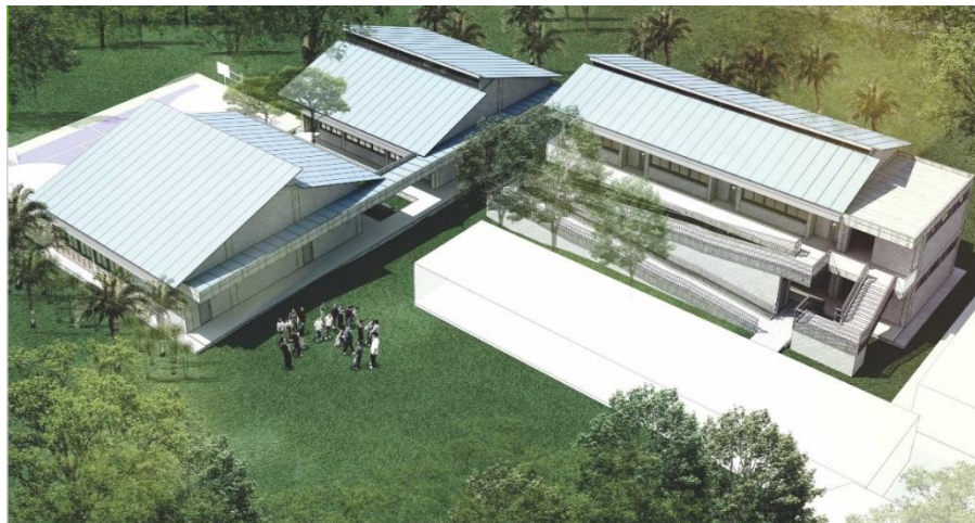
Proyección estudios y diseños del proyecto.

Lote identificado bajo la Matrícula Inmobiliaria No. 370-742076 de Jamundí, de propiedad del MUNICIPIO DE JAMUNDÍ – VALLE DEL CAUCA.