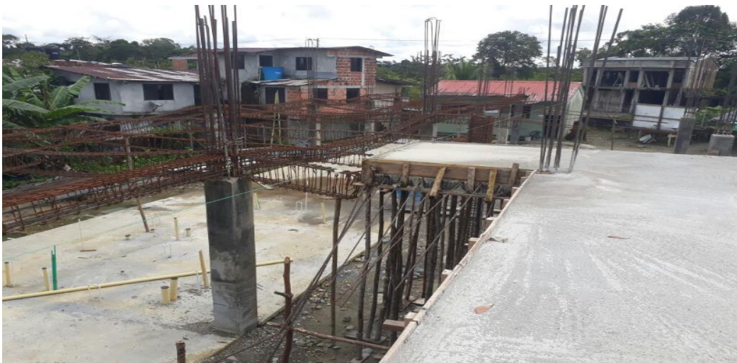
PANORAMICA ESTADO ACTUAL OBRA