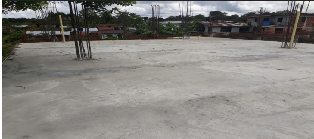
PANORAMICA ESTADO ACTUAL OBRA

El Contrato resultante podrá ser modificado adicionando uno o más Proyectos, en este último caso, se evaluará y determinará bajo las condiciones técnicas y económicas presentadas en la oferta del Contratista seleccionado.