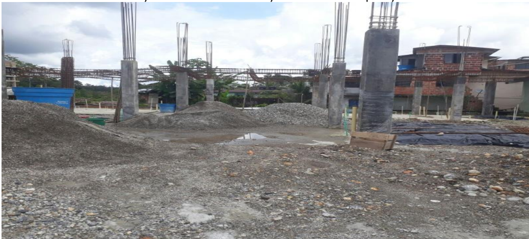
PANORAMICA ESTADO ACTUAL OBRA