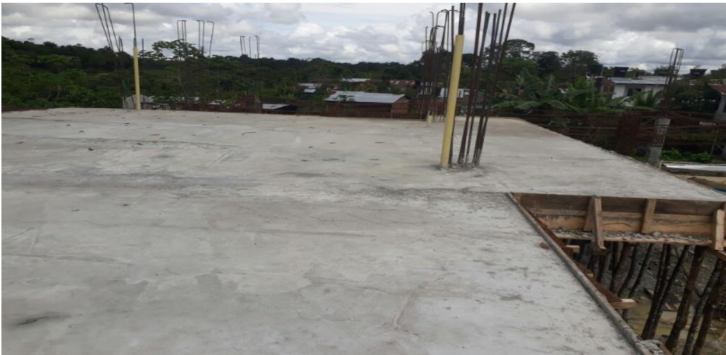
PANORAMICA ESTADO ACTUAL OBRA