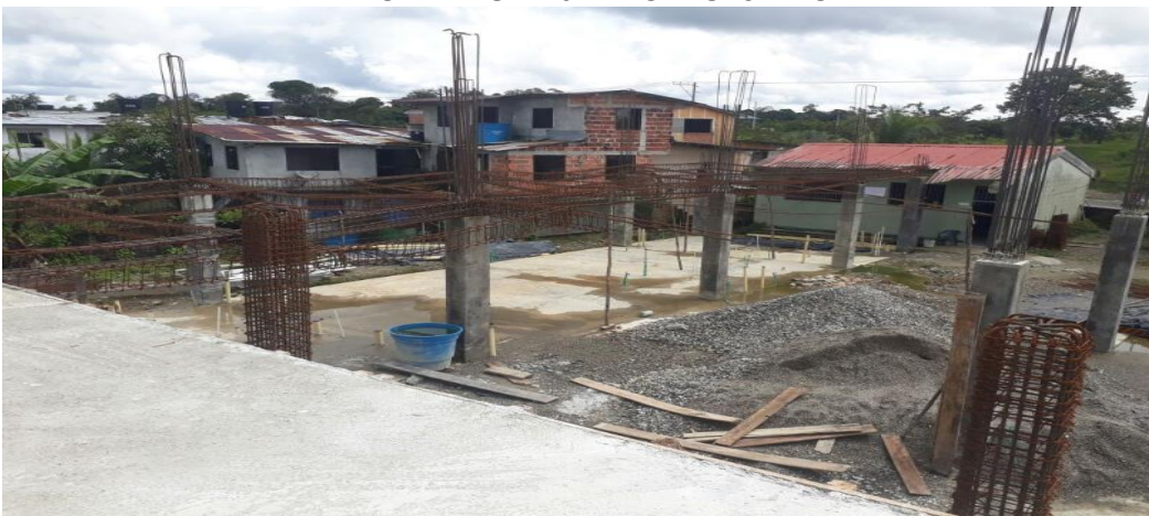
PANORAMICA ESTADO ACTUAL OBRA