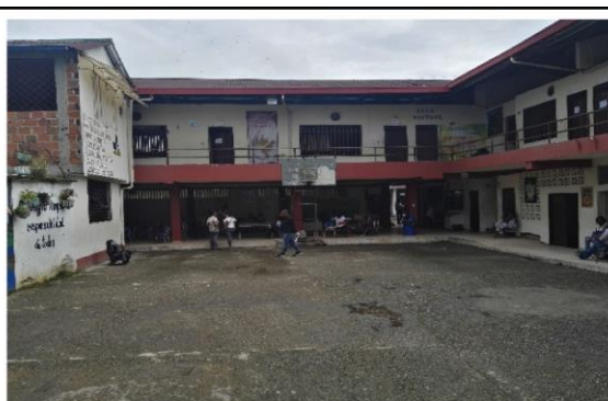
Fotografía 2. Estado actual Infraestructura Educativa