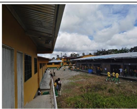
Fotografía 2. Estado actual Infraestructura Educativa