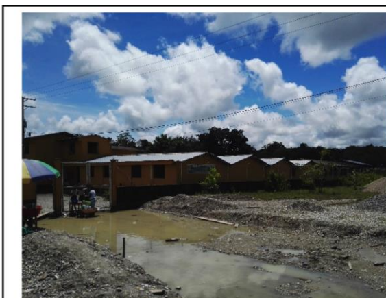
Fotografía 1. Vista frontal de la IE.