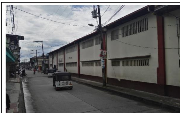
Fotografía 1. Vista frontal de la IE.