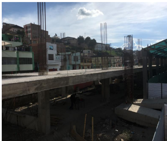
PANORAMICA ESTADO ACTUAL OBRA