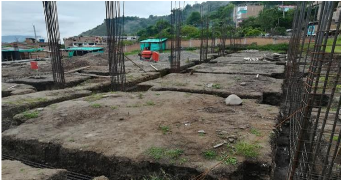
PANORAMICA ESTADO ACTUAL OBRA