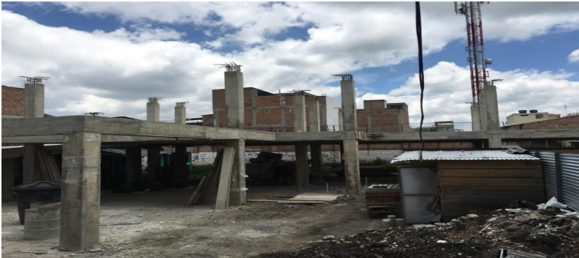
PANORAMICA ESTADO ACTUAL OBRA