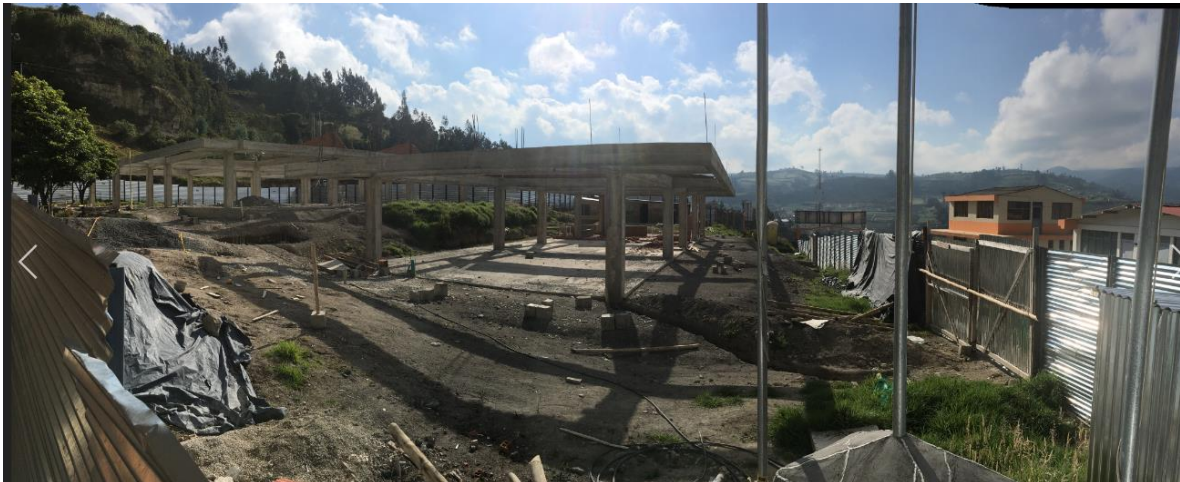
PANORAMICA ESTADO ACTUAL OBRA