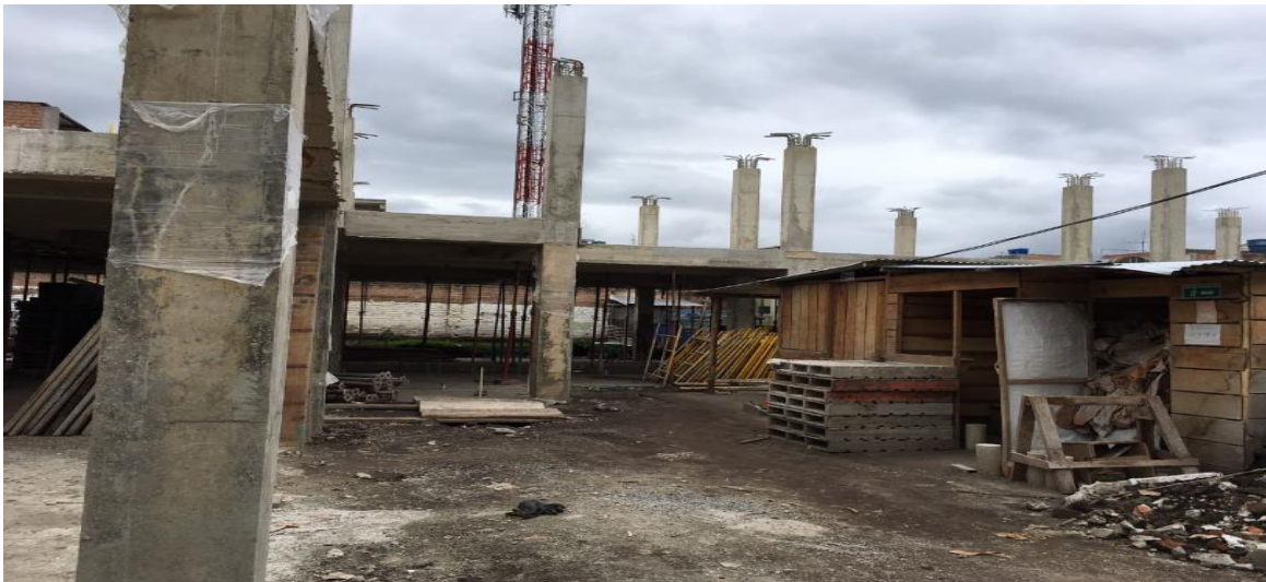
PANORAMICA ESTADO ACTUAL OBRA