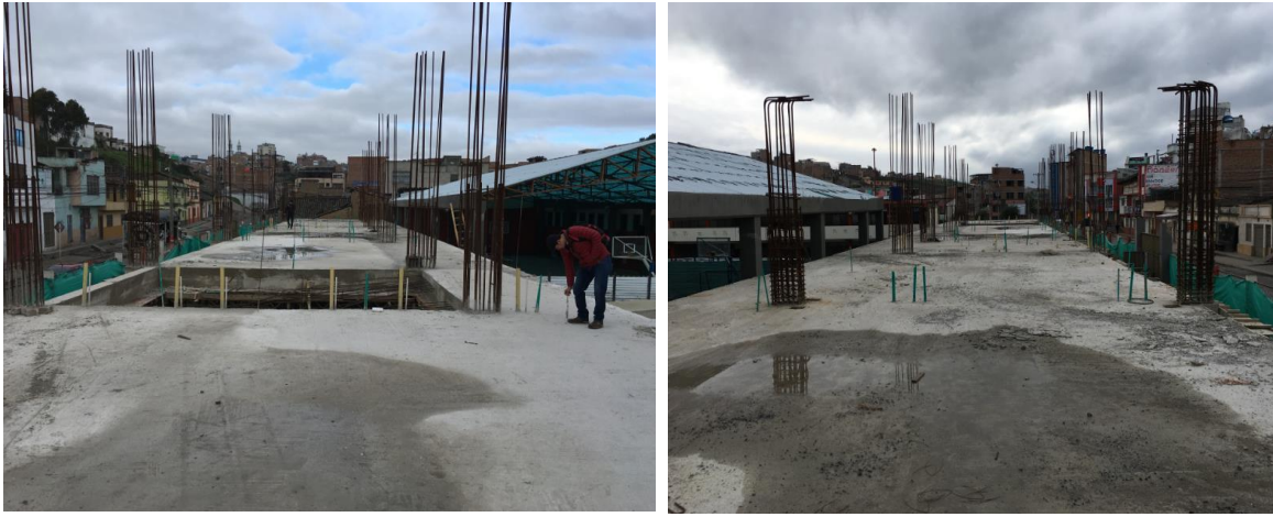
ESTADO ACTUAL OBRA