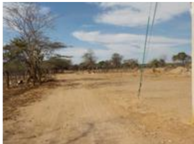
Foto predio Los Arrayanes o Recreo. Matrícula inmobiliaria N° 212-56792