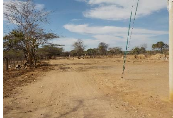
Foto predio Los Arrayanes o Recreo. Matrícula inmobiliaria N° 212-56792