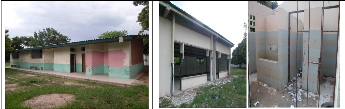
Fotografía 1. Estado actual Infraestructura Educativa.