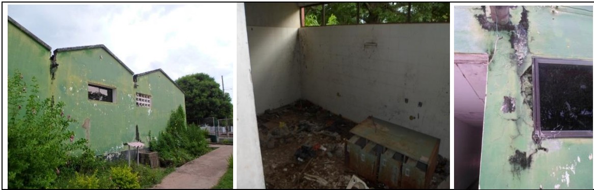
Fotografía 1. Estado actual Infraestructura Educativa.

Los anteriores proyectos podrán ser modificados o adicionado alguno más, en este último caso se evaluará bajo las condiciones técnicas y económicas prestadas por el contratista en los demás proyectos adjudicados previa la modificación contractual requerida.