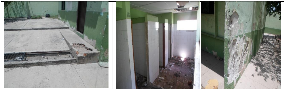
Fotografía 1. Estado actual Infraestructura Educativa.