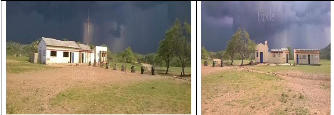
Fotografía 1. Estado actual Infraestructura Educativa.