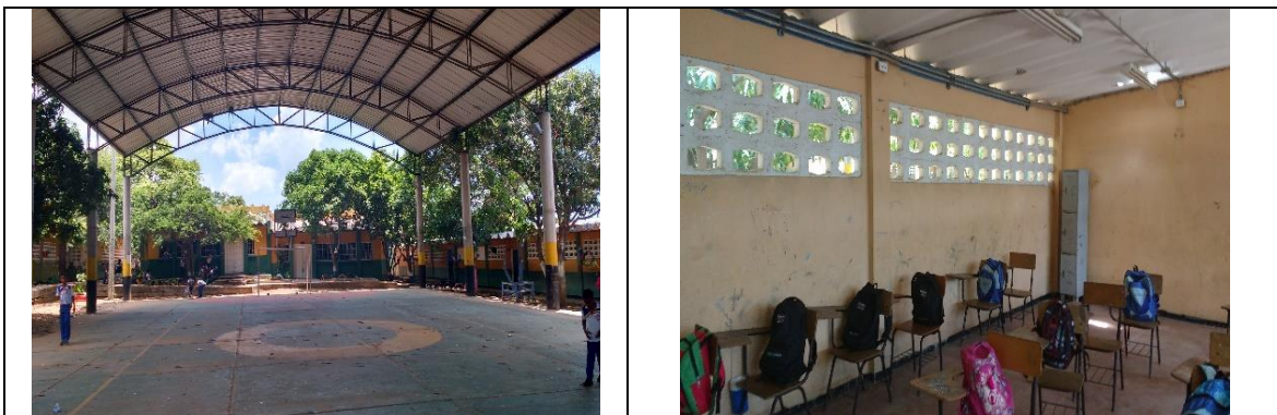
Fotografía 1. Estado actual Infraestructura Educativa.