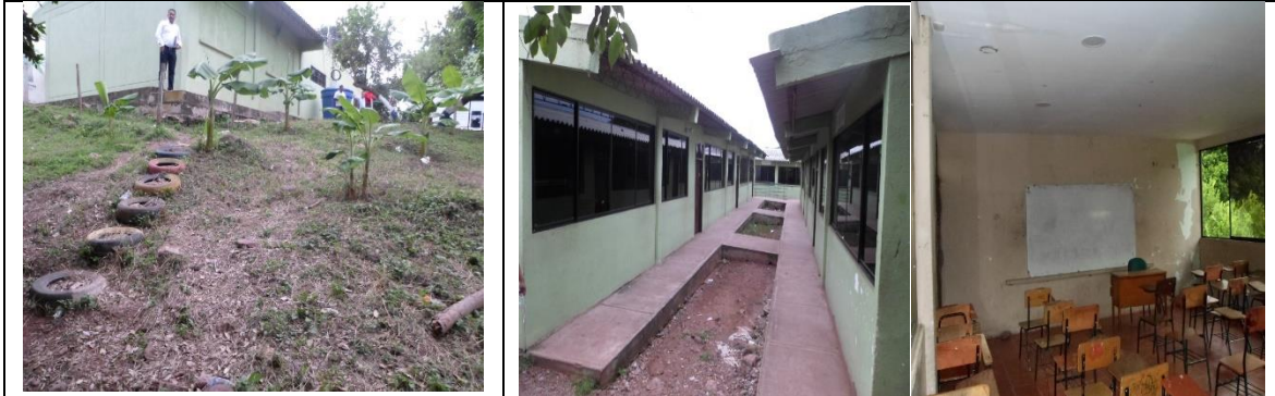
Fotografía 1. Estado actual Infraestructura Educativa.