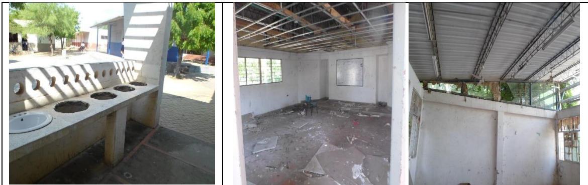
Fotografía 1. Estado actual Infraestructura Educativa.