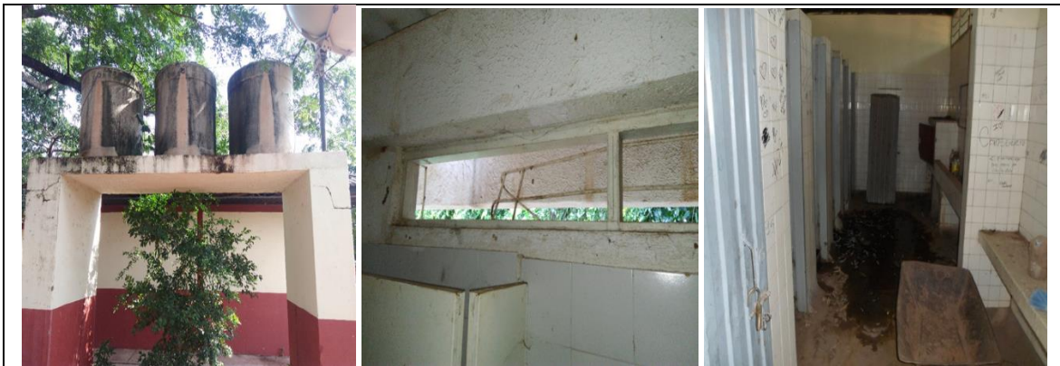
Fotografía 1. Estado actual Infraestructura Educativa.