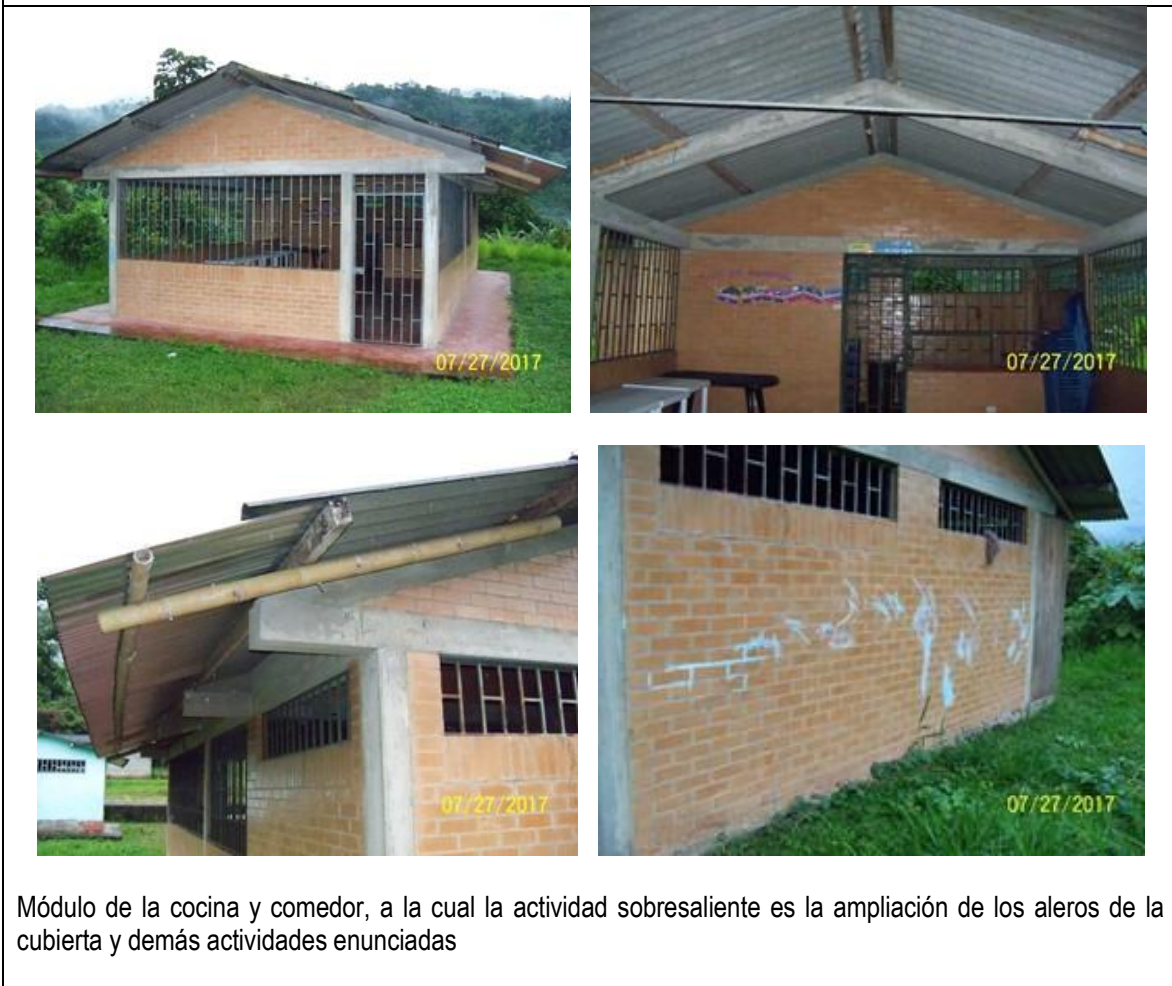
Módulo de la cocina y comedor, a la cual la actividad sobresaliente es la ampliación de los aleros de la cubierta y demás actividades enunciadas