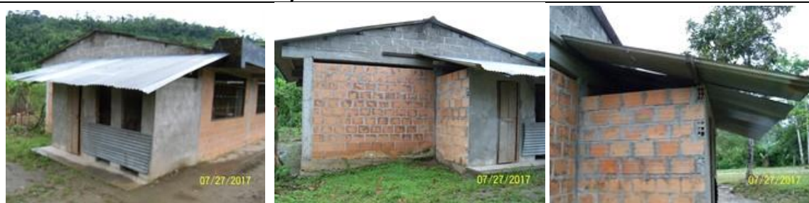
Batería de baños existentes y a reponer.

ESTADO DEL CAMINO HACIA LOS PROYECTOS EN EL RESGUARDO INDIGENA: