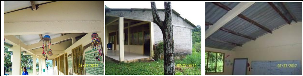
Área adecuación modulo aulas educativas, en la cual se visualiza la cubierta y muros a intervenir