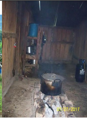
Estado de la cocina actual y que deberá ser diseñada y construida en la misma área disponible