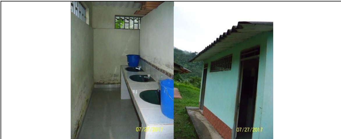
Módulo de la batería sanitaria a intervenir.