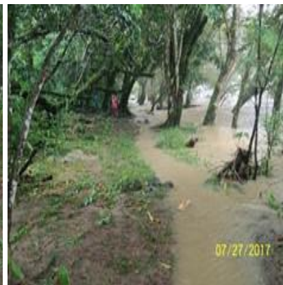
Estado de la ruta de traslado de la IE Osococha hacia la IE Las Vegas.