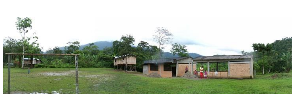
Panorámica del proyecto a intervenir, en la cual se visualiza los módulos existentes, el aula y comedor-cocina a intervenir