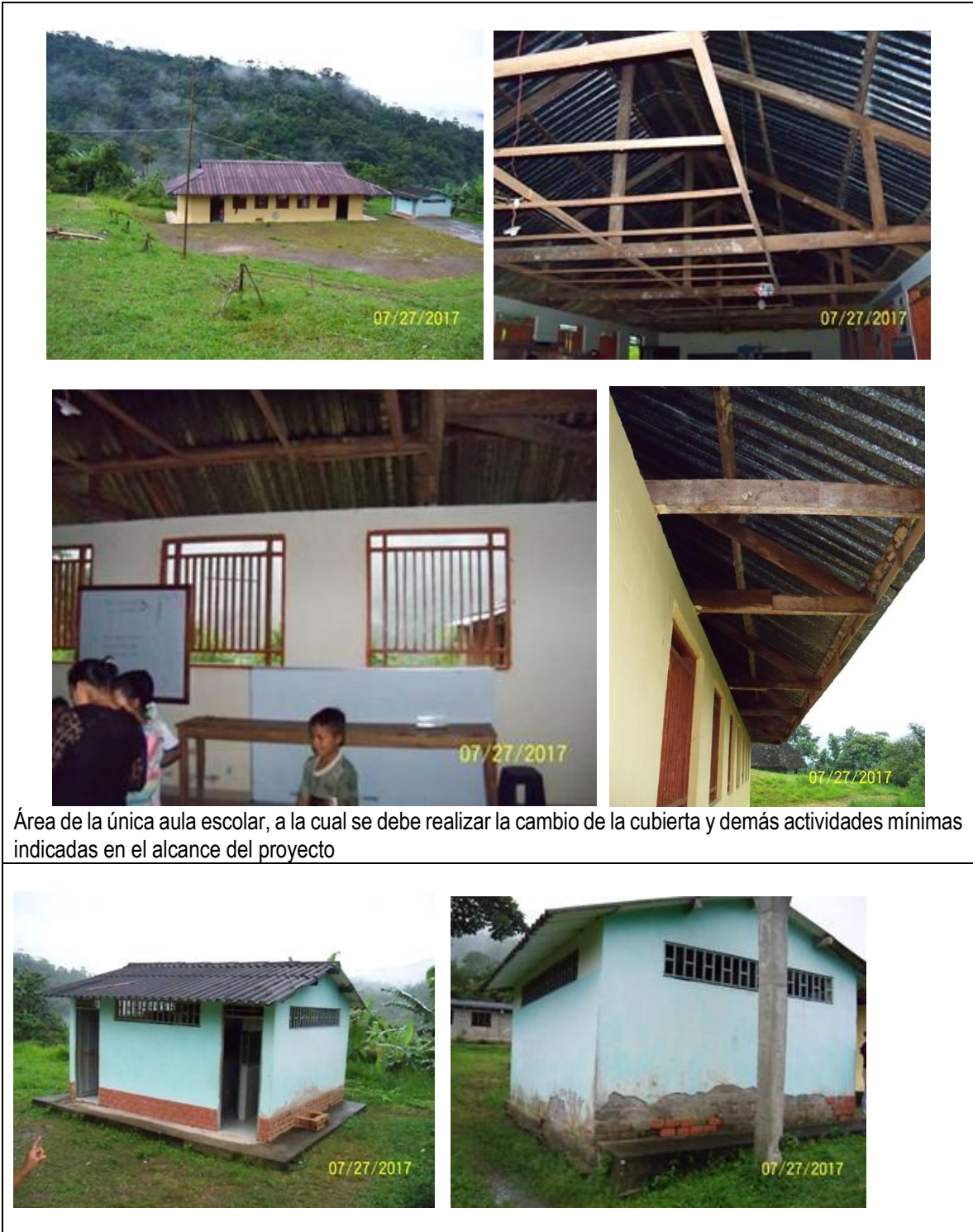
Área de la única aula escolar, a la cual se debe realizar el cambio de la cubierta y demás actividades mínimas indicadas en el alcance del proyecto