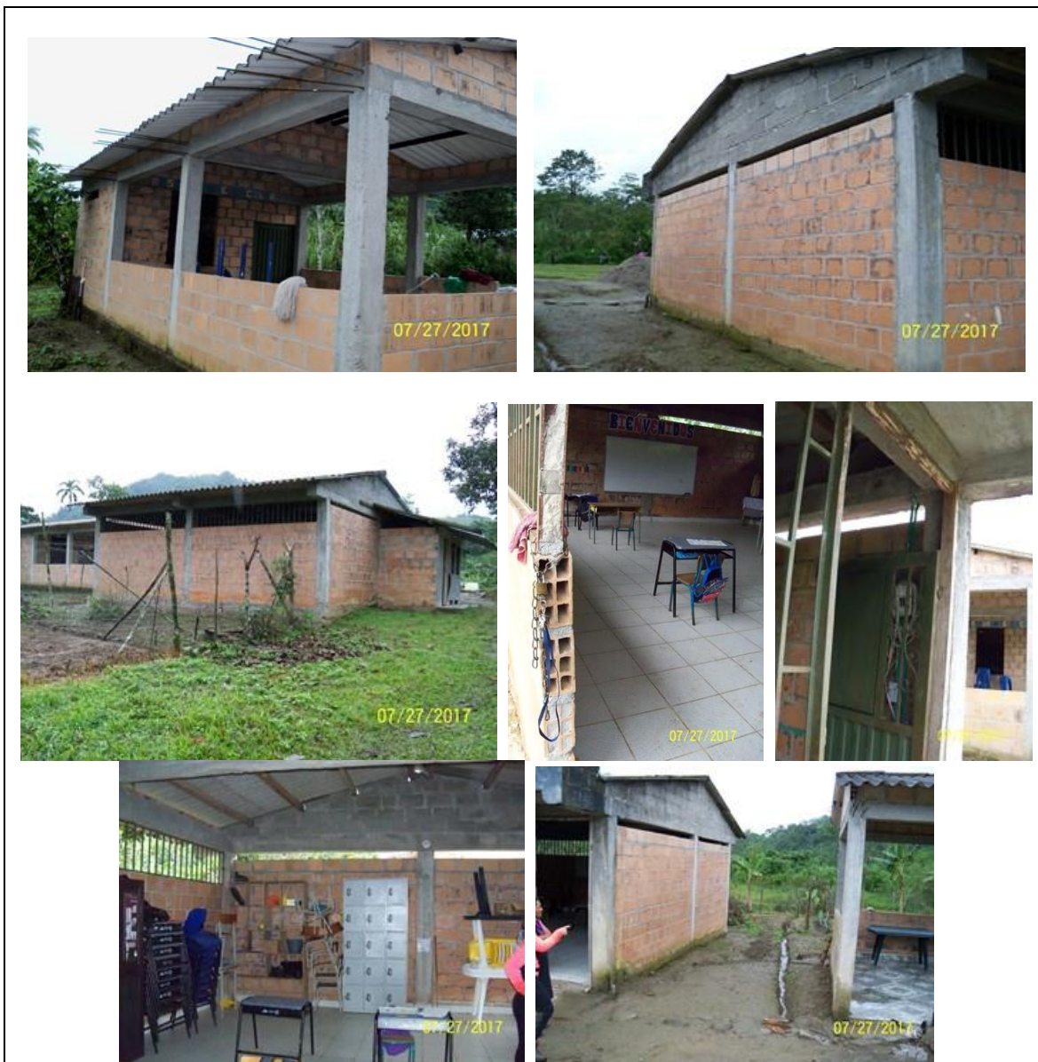
Modulo del aula escolar a intervenir y área de circulación existente.