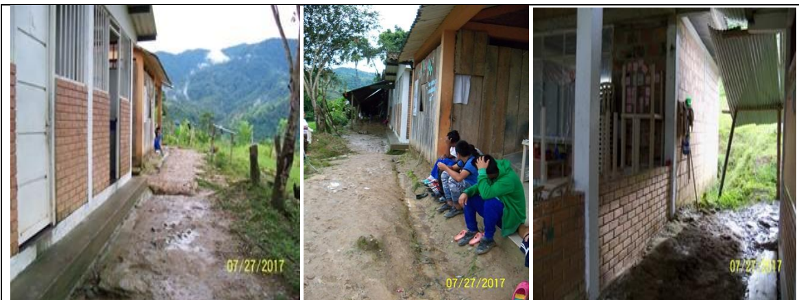
Área disponible para la circulación cubierta, la cual comunicará los módulos de dormitorio niñas, batería baños, comedor, dormitorio niños y cocina