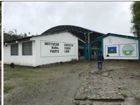
Accesibilidad a la Institución Educativa: De la vía que comunica Mocoa a Villa garzón - Puerto Asís, se desprende vía carreteable hasta la vereda el Limón, aprox. a 13 km. de la vía principal. Disponibilidad de servicios públicos.