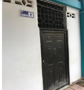
Baños: Baterías sanitarias a reponer.