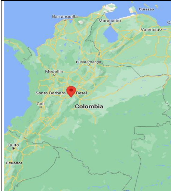
Imagen No. 1 Ubicación de Fusagasugá en el mapa de Colombia