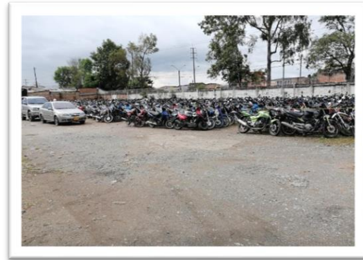
Fotografía 2. Vista actual del predio