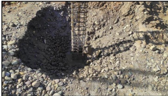
Terreno de excavaciones cedido.

Una vez llegada a la cota de implantación, se procedió con la excavación de las zapatas las cuales tenían una profundidad de 1.35 m, aclarando que por estar en un terreno inundable, la ejecución de esta actividad fue muy compleja, pues por las continuidad de las lluvias en el sector, hacían que durante el proceso de excavación se acumulara agua y al saturarse el suelo de relleno los taludes colapsaban. Dentro del plan de contingencia se procedió a implementar una bomba para la extracción del agua y cubrir en las noches las excavaciones (en caso de que se presentaran lluvias); pero estas situaciones fueron insuficientes por la cantidad de agua que llegaba por escorrentía, lo que causaba el colapso constante de las excavaciones debido a que la ubicación de las zapatas eran en zonas donde se tenían parte de rellenos y estos por más de garantizar un proctor de compactación cedían por la fuerza y empuje del agua.