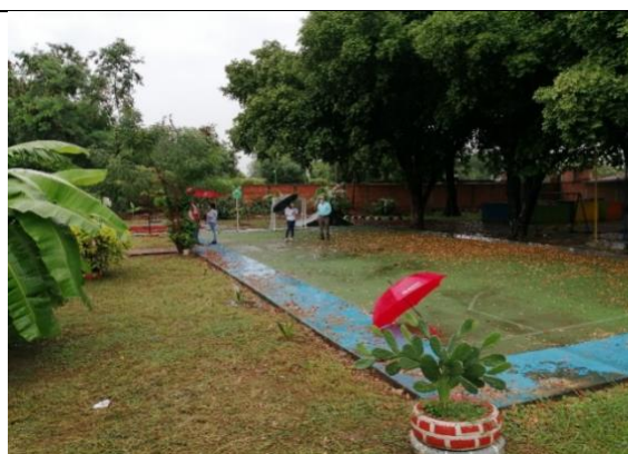
Fotografía 2. Vista actual del predio Cúcuta