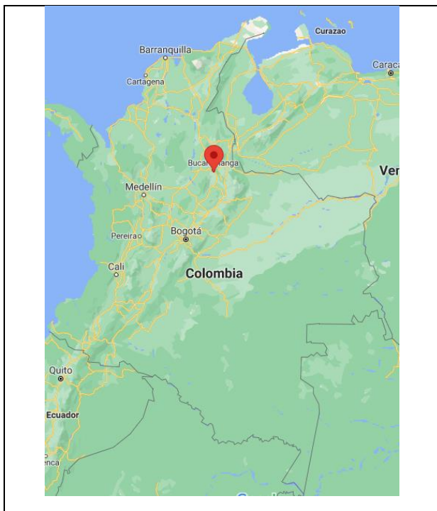
Fotografía 1. Localización proyecto Florida Blanca