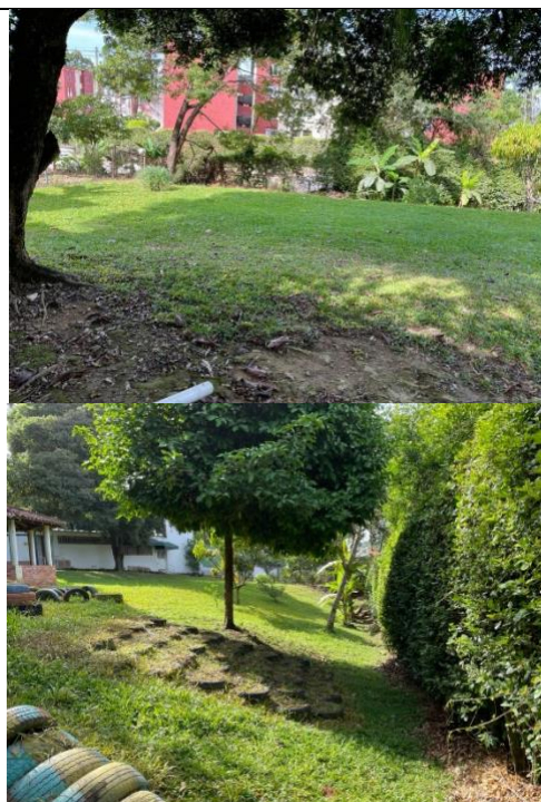
Fotografía 2. Vista actual del predio Florida Blanca