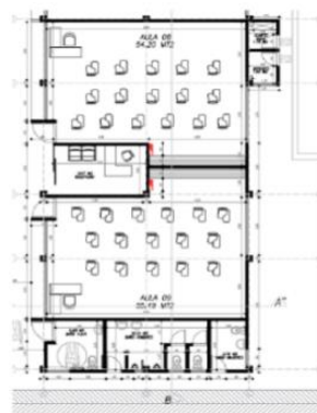
Esquema Final para los Diagnósticos

Se puede evidenciar que se debe realizar mayores intervenciones, una de ellas es la reubicación completa de baterías las sanitarias, por cuanto las existentes no cumplen con la normatividad para personas con movilidad reducida, lo que implica trasladar la ubicación de los baños y por consiguiente su distribución. Así mismo para dar cumplimiento a los lineamientos de estándares de calidad para los Centros de Atención Especializada, denominada “GUIA PARA LA ELABORACION DE CONCEPTOS MINIMOS Y ESTÁNDARES ARQUITECTÓNICOS PARA LA INFRAESTRUCTURA DEL SISTEMA DE RESPONSABILIDAD PENAL PARA ADOLESCENTES EN COLOMBIA se requiere el suministro e instalación de aparatos sanitarios antivandálicos , tal como se muestra a continuación: