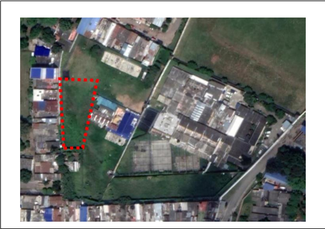
Fotografía 3. Zona Propuesta para la Ejecución del Proyecto – Resaltado en rojo