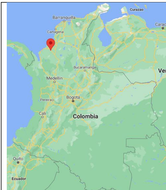
Fotografía 1. Localización proyecto