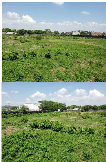
Fotografía 2. Vista actual del predio