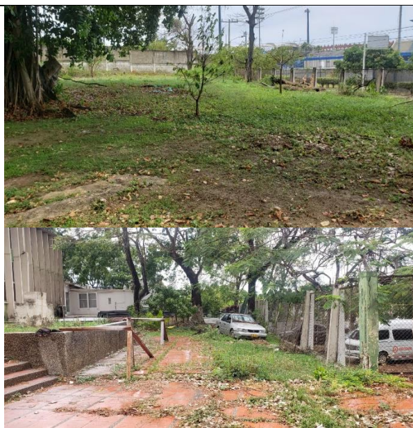
Fotografía 2. Vista actual del predio