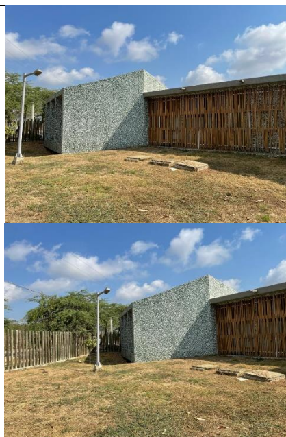
Fotografía 2. Vista actual del predio