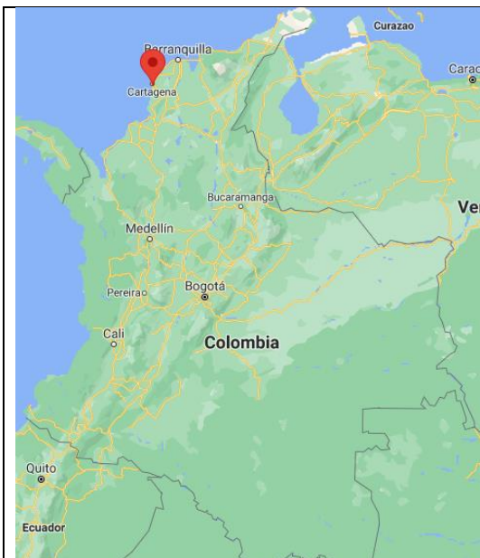
Fotografía 1. Localización proyecto