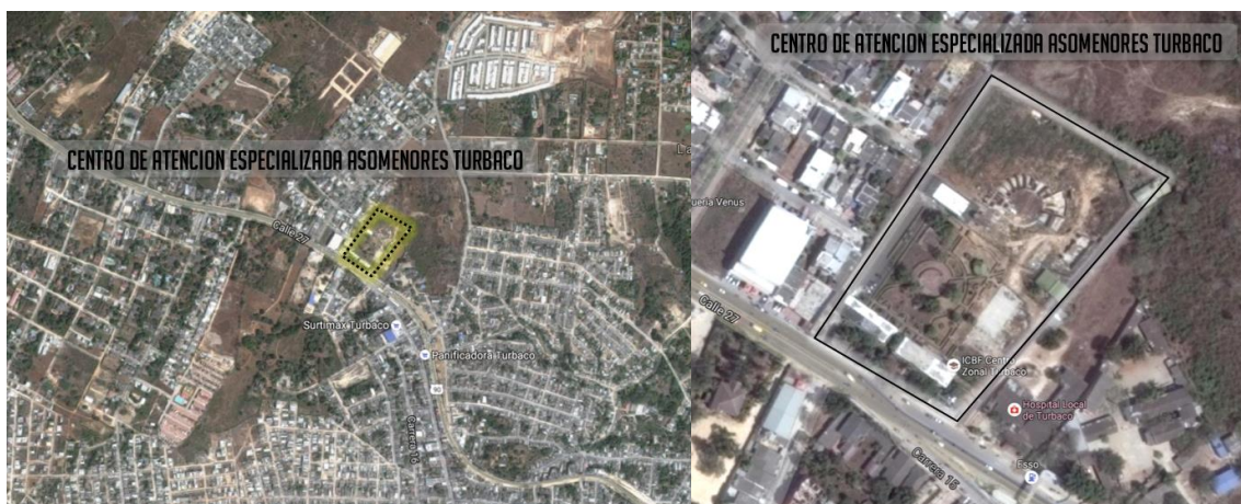
Figura 2. Localización Centro de Atención especializada Asomenores – Turbaco

El Centro de Formación Juvenil del Valle, de la Ciudad de Cali, Departamento del Valle del Cauca en el Callejón vía Comfenalco Carrera 108 No.48-91 en la ciudad de Cal. El Centro de Formación Valle de Lili, se encuentra ubicado en el municipio de Cali kilómetro 1 Vía a Jamundí, a unos 500 metros de la vía principal en zona de formación urbana