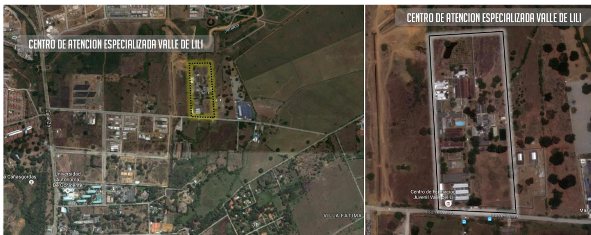
Figura 4. Localización Centro de Formación Juvenil de Valle de Lili Ciudad de Cali Departamento de Valle del Cauca