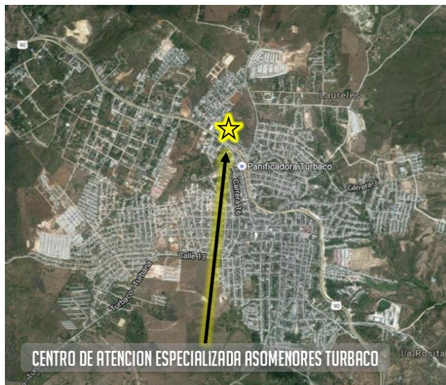
Figura 1. Localización Centro de Atención especializada Asomenores – Turbaco