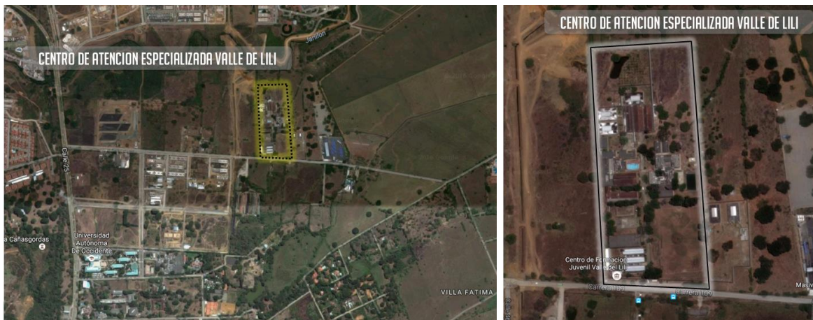
Figura 4. Localización Centro de Formación Juvenil de Valle de Lili Ciudad de Cali Departamento de Valle del Cauca