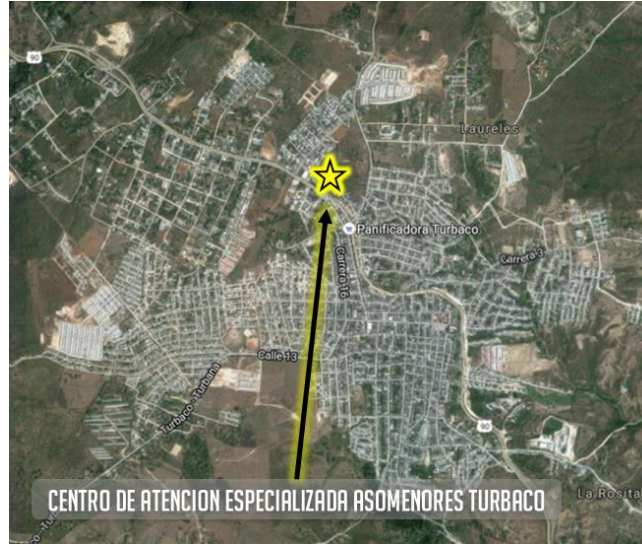
Figura 1. Localización Centro de Atención especializada Asomenores – Turbaco