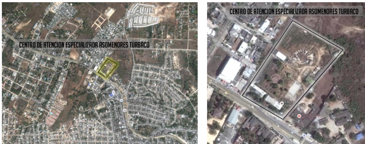
Figura 2. Localización Centro de Atención especializada Asomenores – Turbaco

El Centro de Formación Juvenil del Valle, de la Ciudad de Cali, Departamento del Valle del Cauca en el Callejón vía Comfenalco Carrera 108 No.48-91 en la ciudad de Cal. El Centro de Formación Valle de Lili, se encuentra ubicado en el municipio de Cali kilómetro 1 Vía a Jamundí, a unos 500 metros de la vía principal en zona de formación urbana