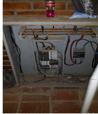
Tablero principal ubicado en comando de guardia