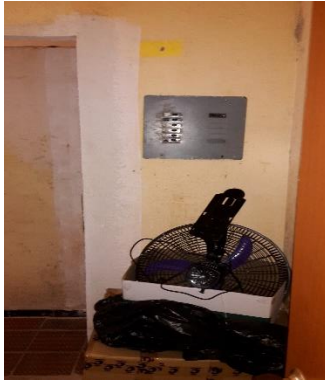
Tablero ubicado en área administrativa