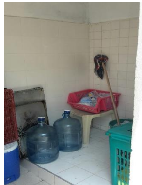
Cuarto de lavatraperos