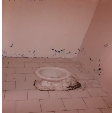
Estado actual de las baterías sanitarias Unidad 2.