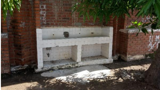
Estado actual lavadero ubicado en la cancha

Se relacionan otros espacios a tener en cuenta para intervención de acuerdo al diagnóstico que se realice y al alcance presupuestal que se realice en la Etapa I