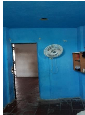
Estado actual de conexiones irregulares y no reguladas de la red eléctrica.