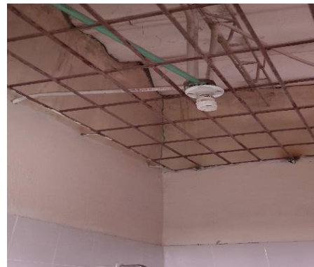
Estado de la red eléctrica de la cocina