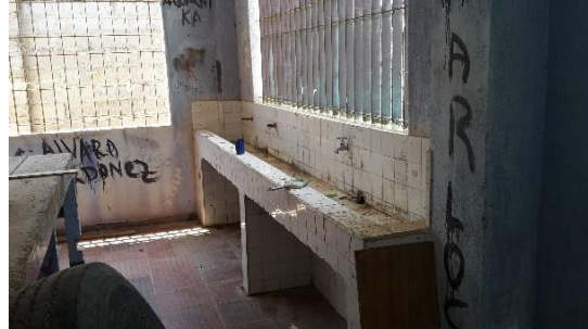
Estado actual lavadero ubicado el salón de carpintería