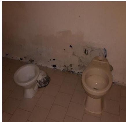
Estado actual de las baterías sanitarias Unidad 1.