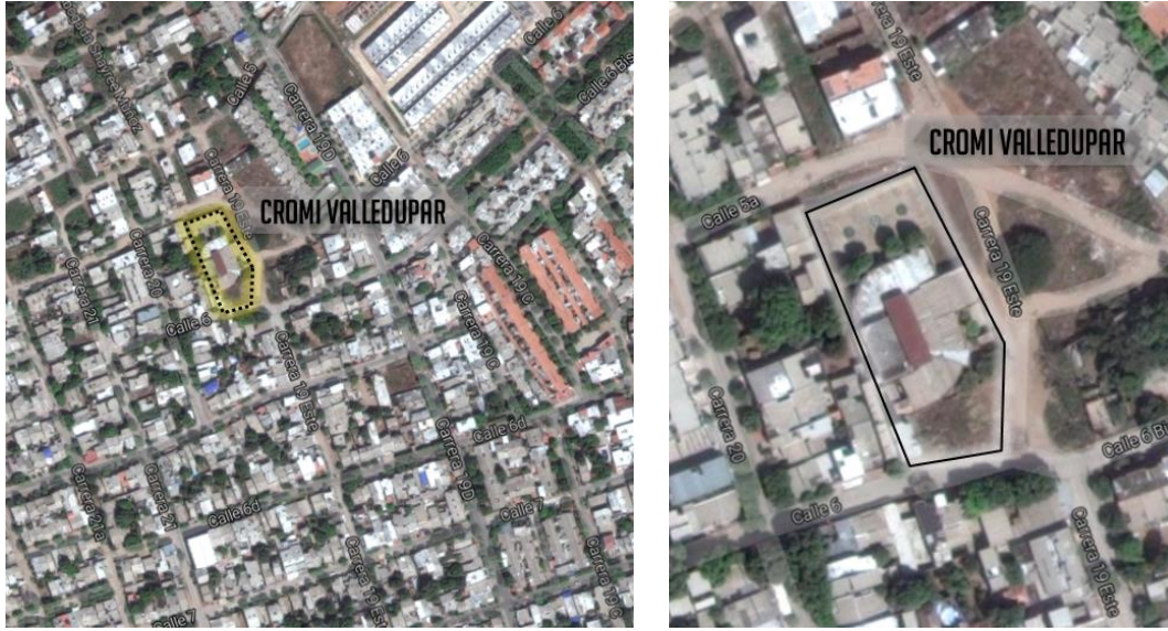
Figura 2. Localización Centro de Atención Especializado en la ciudad de Valledupar departamento de Cesar.